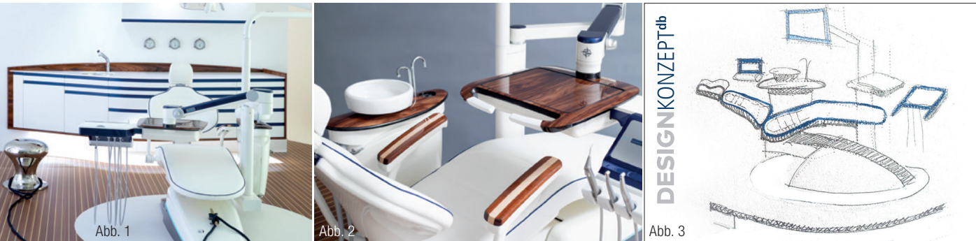
Abb. 1 und 2: Die dentale Exklusivlinie „bluamarina“ richtet sich an alle, die Ästhetik individuellen Designs Tag für Tag gemeinsam mit Patienten in den Räumen ihrer Praxis erleben und dieser dabei ein Alleinstellungsmerkmal verleihen möchten. Abb. 3: Die Designwelt von dental bauer trägt ab sofort den Namen DESIGNKONZEPT db .

Alljährliche Design Awards bestätigen dental bauer seit Langem hervorstechende kreative Ideen in puncto innovativer Praxisgestaltung. Der bereits jahrzehntelang bestehenden Leistungssparte wurde nun ein Name gegeben: DESIGNKONZEPT db . Als symbolisches Beispiel für eine Vielzahl an thematischen Optionen ist mit „bluamarina“ eine maritime Exklusivlinie entstanden, bestehend aus einer eleganten Behandlungseinheit mit passendem Möbelsystem. Dabei trifft mediterranes Dolce-Vita-Flair auf Patientenkomfort und Funktionalität, hygienische und technische Standards „made in Germany“ und auf stilvolle Exklusivität. Die Behandlungseinheit besticht durch detailverliebte, zeitlose Eleganz in Kombination mit modernster Technik. Die ergonomische Form, die komfortable Softpolsterung mit optischer Steppung und umlaufendem Keder sowie das hochwertige Mahagoni- und Ahorn-Echtholz der Armlehnen korrespondieren ideal mit der Sonderlackierung in den maritimen Farben Reinweiß, Perlnachtblau und Türkis. Auf Wunsch der Kunden sind weitere Farbkompositionen möglich. Chromelemente unterstreichen die Yacht-Optik. Als besonderes