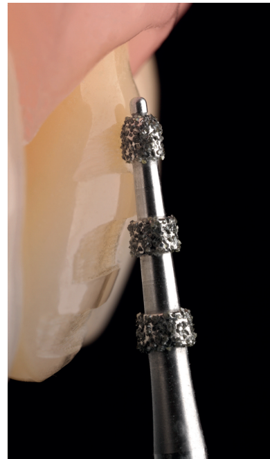
Der konische Tiefenmarkierer mit Führungsstift (868BP) begrenzt die Eindringtiefe selbst bei zu steiler Positionierung.

kronen (4573/ST) auf den Markt brachte. Darauf reagierten wir 2013 mit dem Vollkeramik-Kompass . Mit diesem praktischen Ringbuch hat der Zahnarzt alle Präparations- und Bearbeitungsregeln für Keramik schnell zur Hand. Über die Jahre integrierten wir darin sukzessive unsere weiteren Innovationen, unter anderem das Okklusionsonlay-Set 4665/ST und den Kronentrenner Jack für vollkeramische Restaurationen. Die Nachfrage nach dem Vollkeramik-Kompass ist bis heute ungebrochen. Gekoppelt mit Fachberichten und Fortbildungsveranstal-