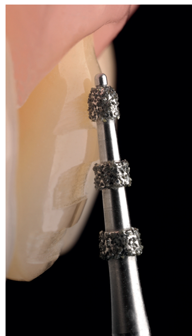
Der konische Tiefenmarkierer mit Führungsstift (868BP) begrenzt die Eindringtiefe selbst bei zu steiler Positionierung.

Wir spüren, dass Zahnärzte verstärkt nach Anwendungslösungen suchen. Nicht das Produkt, sondern die Anwendung steht bei unseren digitalen Themenwelten im Fokus. In der Themenwelt „Vollkeramik & CAD/CAM“ bündeln wir alle Informationen und Services rund um diesen Anwendungsbereich. Wir haben das komplexe Thema keramikgerechte Präparation so heruntergebrochen, dass es nun autodidaktisch für den Zahnarzt viel leichter zu erlernen und umzusetzen ist. Er wird sich im konkreten Fall ja immer eingangs fragen: Wie gehe ich bei dieser Indikation keramikkonform vor und – erst im nächsten Schritt – welche Instrumente helfen mir dabei? Deshalb holen wir ihn bei der jeweiligen Indikation ab (zum Beispiel Veneers, Okklusiononlays, Inlays/Teilkronen oder klassische Kronen). Unter der Rubrik „Veneers“ sind zum Beispiel der Veneer-Kompass und die PVP-Broschüre Dreh- und Angelpunkt für das korrekte Instrumentieren. Aber auch das Thema der Abrechnung wird aufgegriffen. Die Fragen zur korrekten Präparationstechnik sind mit Videos, vielfältigen Fachinformationen und Literaturhinweisen hinterlegt. Er muss nicht mehr suchen. Anstelle „reiner Bohrerabbildungen“ stehen klinische und in-