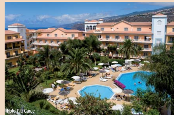
Hotel RIU Garoe