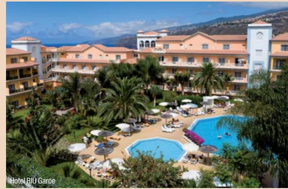
Hotel RIU Garoe

ZWP online Weitere Informationen auf www.zwp-online.info