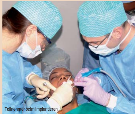
Teilnehmer beim Implantieren

Die Teilnehmer lernen ein neues Implantatssystem kennen und können sich ganz und gar auf das Inserieren der Implantate konzentrieren. An der Seite eines erfahrenen deutschen Implantologen arbeiten die Teilnehmer in kleinen Gruppen.