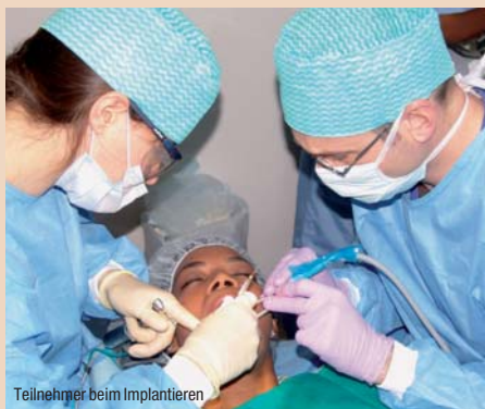
Teilnehmer beim Implantieren

Die Teilnehmer lernen ein neues Implantatssystem kennen und können sich ganz und gar auf das Inserieren der Implantate konzentrieren. An der Seite eines erfahrenen deutschen Implantologen arbeiten die Teilnehmer in kleinen Gruppen.