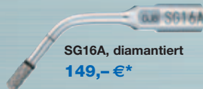
SG16A, diamantiert 149,- €*