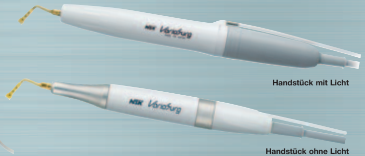
Handstück mit Licht