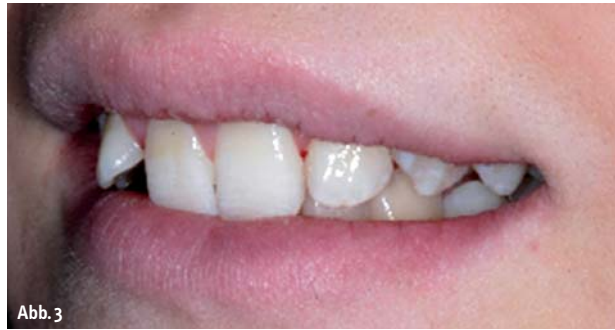
Abb. 2 und 3: Patientin, vor Beginn der Behandlung.