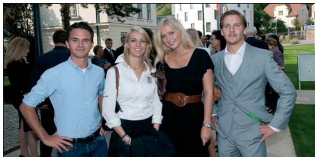
Die erste Studiengruppe der DPU startete am 21. September 2009.

Das Dental Excellence-Studium ist vom Österreichischen Akkreditierungsrat (ÖAR) akkreditiert, europaweit anerkannt, entspricht voll in allen Punkten den europäischen Bildungsrichtlinien. Mit besonders praxisorientierter Betreuung durch hoch angesehene Wissenschaftler, von 2.000 universitär weitergebildeten praktizierenden Zahnärzten/-innen evaluiert, wird höchster Bildungsanspruch erfüllt. Die Danube Private University (DPU) bildet junge Studierende zu exzellenten Zahnärzten/-innen aus, deren Praxen sich mit „State of the Art“ bei den Patienten auszeichnen. Außerdem bieten wir mit dem Bachelor/Master of Arts Medizinjournalismus