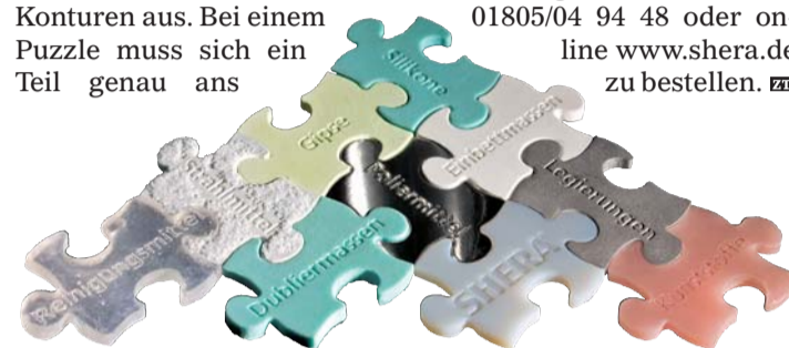
Im neuen Katalog sind die Produktlinien wie Puzzleteile aufeinander abgestimmt.

den, sich aus den fast 90 Seiten umfassenden Katalog die für das eigene Labor passenden Puzzleteile zusammenzustellen. Auch das Stöbern darin macht dank der ästhetisch dargestellten SHERA-Produkte viel Spaß. SHERA-Mitarbeiterin Irina Zielke hat beim Fotografieren dieser Produkte ein gutes Auge bewiesen. Der Katalog ist bei der SHERA Werkstoff-Technologie unter Telefon 01805/04 94 48 oder online www.shera.de zu bestellen. ZT