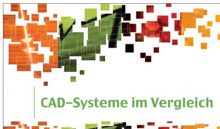
Im Oktober können Zahntechniker einen Überblick über die verschiedenen CAD-Systeme erhalten.

DIGITAL_DENTAL.NEWS Lindemannstraße 90 40237 Düsseldorf Tel.: 02 11/44 03 74-0 Fax: 02 11/44 03 74-15 E-Mail: info@ddn-online.net www.ddn-online.net