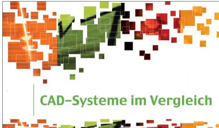
Im Oktober können Zahntechniker einen Überblick über die verschiedenen CAD-Systeme erhalten.

DIGITAL_DENTAL.NEWS Lindemannstraße 90 40237 Düsseldorf Tel.: 02 11/44 03 74-0 Fax: 02 11/44 03 74-15 E-Mail: info@ddn-online.net www.ddn-online.net