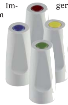
Nur vier verschiedene Scanaufbauten sind nötig.

Das Thema der 1. Münchner Stammtischrunde 2010 könnte kurz lauten – der künftige Erfolg des Dentallabors liegt nicht im Outsourcing. Um die Wertschöpfung im Labor zu halten, entwickelte Wieland Dental + Technik das Zenotec Titanbasen-System als Anwendungserweiterung der CAD/CAM-Technik. Die Zenotec Titanbasen gibt es passend zu vielen führenden Implantatsystemen, um individuelle Aufbauten aus Zirkonoxid mit gingivagerechten Austrittsprofilen herzustellen. Es sind nur maximal vier verschiedene Scanaufbauten notwendig, zudem im System enthalten sind die Laborschraube und die Halteschraube für die Insertion am Patienten. Die Grundkonstruktion der Titanbasis ist dabei so ausgefeilt, dass die Krafthelwirkung nicht auf das Zirkonoxid wirkt. Das bestätigt auch das Fraunhofer-Institut für Werkstoffmechanik, welches das Titanbasensystem in den Kategorien Kraftwirkung und Beständigkeit uneingeschränkt positiv bewertet. Anschaulich führten Alexander Schröck, Produktmanager CAM-Software der Wieland Dental + Technik, und der externe Referent ZTM