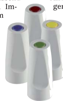
Nur vier verschiedene Scanaufbauten sind nötig.

Das Thema der 1. Münchner Stammtischrunde 2010 könnte kurz lauten – der künftige Erfolg des Dentallabors liegt nicht im Outsourcing. Um die Wertschöpfung im Labor zu halten, entwickelte Wieland Dental + Technik das Zenotec Titanbasen-System als Anwendungserweiterung der CAD/CAM-Technik. Die Zenotec Titanbasen gibt es passend zu vielen führenden Implantatsystemen, um individuelle Aufbauten aus Zirkonoxid mit gingivagerechten Austrittsprofilen herzustellen. Es sind nur maximal vier verschiedene Scanaufbauten notwendig, zudem im System enthalten sind die Laborschraube und die Halteschraube für die Insertion am Patienten. Die Grundkonstruktion der Titanbasis ist dabei so ausgefeilt, dass die Krafthebelwirkung nicht auf das Zirkonoxid wirkt. Das bestätigt auch das Fraunhofer-Institut für Werkstoffmechanik, welches das Titanbasensystem in den Kategorien Kraftwirkung und Beständigkeit uneingeschränkt positiv bewertet. Anschaulich führten Alexander Schröck, Produktmanager CAM-Software der Wieland Dental + Technik, und der externe Referent ZTM