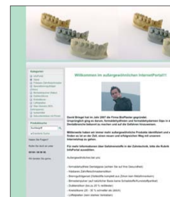
Die Internetseite www.gesundezahntechnik.de gibt Tipps zum Thema gesundes Arbeiten in der Zahntechnik.

umgehend mit Ihnen in Verbindung setzen. ZT