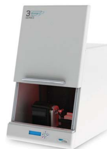
Mit dem 3Series können sechs Stümpfe innerhalb eines Scanprozesses digitalisiert werden.

lichkeit aus und umfasst u.a. Module für Konstruktion von Kronen und Brücken sowie Abutments. Die Konstruktionsdaten können auf die Fertigung mit Fräs-, Rapid Prototyping- und Lasersinter-einheiten abgestimmt werden. Möglich ist auch eine Aufbereitung von Scandaten für die computergestützte Herstellung entsprechender Modelle. Workshops mit Systemvorstellung finden am 19.03. und 26.03.2010 in Alling bei München statt, Anmeldung unter digital-dental-solutions/Aktuelles . ZT