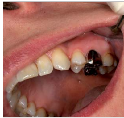
Die ZAHNWERK-Vollzirkonkrone ist eine Alternative zur NEM-Krone.

Kunden für die Gerüste aus Zirkon, NEM, Titan, Composite und PMMA sind sowohl Dentallabore als auch Zahnarzt-Praxislabore im In- und europäischen Ausland. Von Kunden mit eigenem Scanner werden Datensätze lediglich gefräst und weiterverarbeitet. Kunden ohne Scan-System senden ihre Sägestumpf-Modelle. Hier übernehmen die fachkundigen und routinierten Techniker bei ZAHNWERK die Modellation und die Fräsung der Arbeit. Alle technischen Komponenten sind mindestens 2-fach vorhanden, sodass bei Ausfall eines Systems keine terminlichen Probleme für den Kunden entstehen. Die technische Ausrüstung von ZAHNWERK basiert