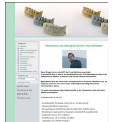
Die Internetseite www.gesundezahntechnik.de gibt Tipps zum Thema gesundes Arbeiten in der Zahntechnik.

umgehend mit Ihnen in Verbindung setzen. ZT