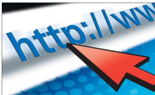
Wie Sie das Internet erfolgreich nutzen können, erfahren Sie beim Seminar der Dentaforum-Gruppe.

im Online-Shop und zur Gestaltung einer optimalen Praxis-Homepage vermittelt. Das Thema Sicherheit im Internet und Empfehlungen zum Datenschutz der Zahn-