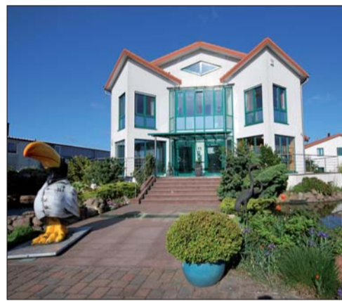
Bei Ahlden werden auch Dentallegierungen geschaffen.

nehmen in regelmäßigen Abständen Sonderkonditionen bei ausgewählten Artikeln, Angebote und spezielle Aktionen für unsere Kunden. Unser Außendienst steht unseren Kunden gerne für weitere Informationen und/oder Terminabsprachen zur Verfügung. Wir möchten die Flexibilität und