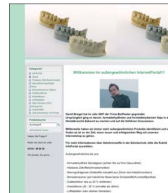
Die Internetseite www.gesundezahntechnik.de gibt Tipps zum Thema gesundes Arbeiten in der Zahntechnik.

umgehend mit Ihnen in Verbindung setzen. ZT