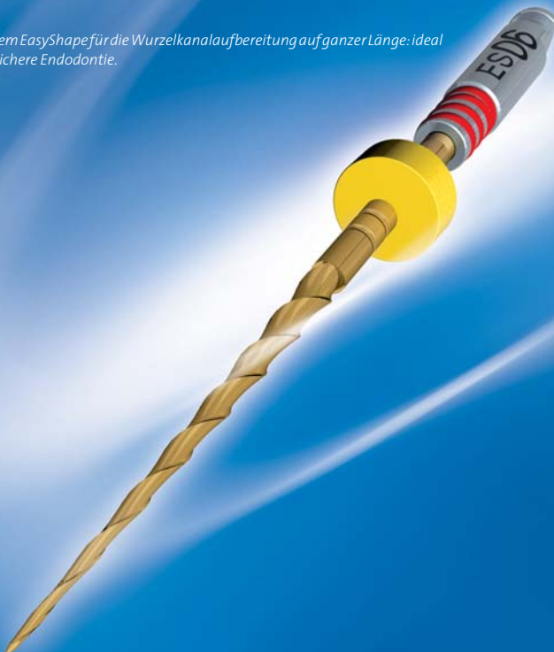
Abb. 2: Das Feilensystem EasyShape für die Wurzelkanalaufbereitung auf ganzer Länge: ideal für den Start in eine sichere Endodontie.