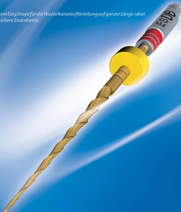
Abb. 2: Das Feilensystem EasyShape für die Wurzelkanalaufbereitung auf ganzer Länge: ideal für den Start in eine sichere Endodontie.