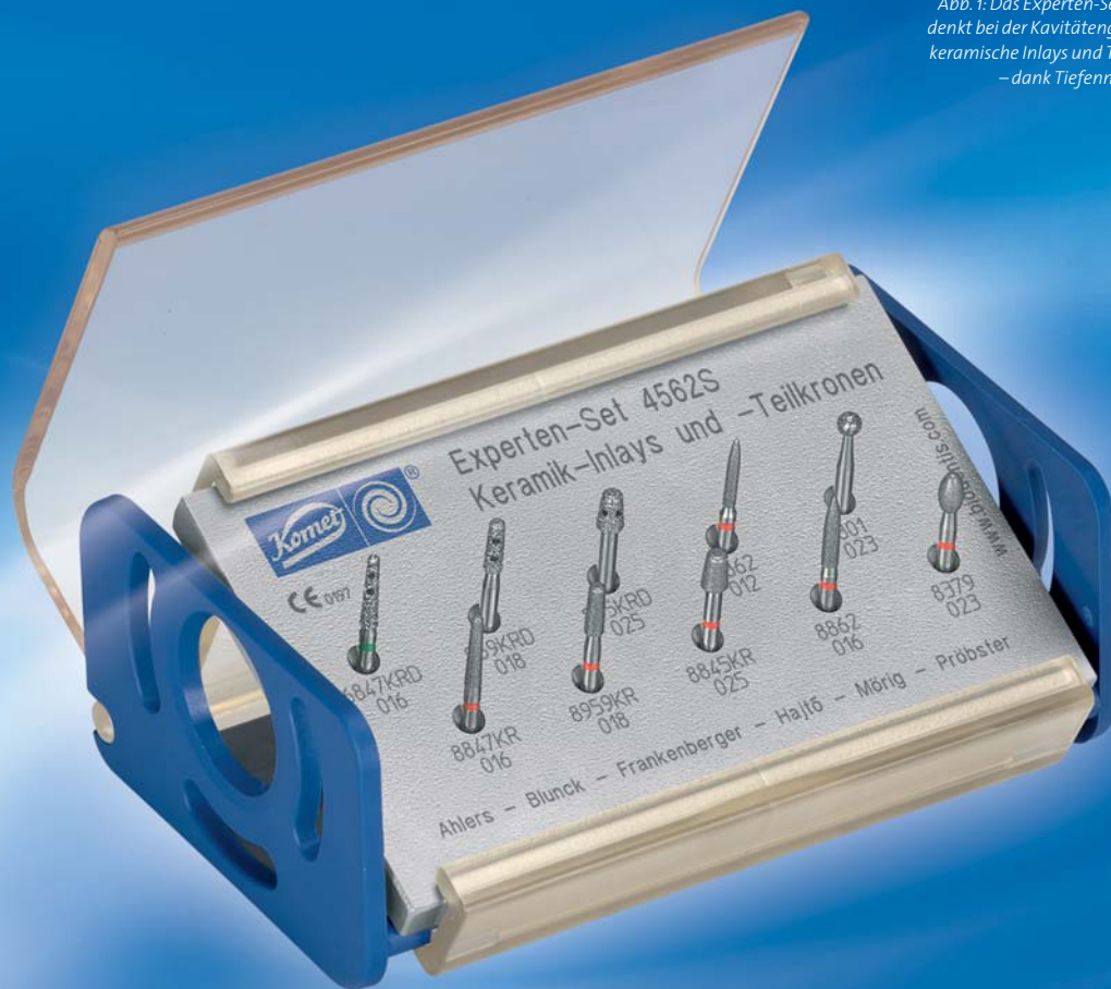
Abb. 1: Das Experten-Set 4562/4562S denkt bei der Kavitätengestaltung für keramische Inlays und Teilkronen mit – dank Tiefenmarkierungen.