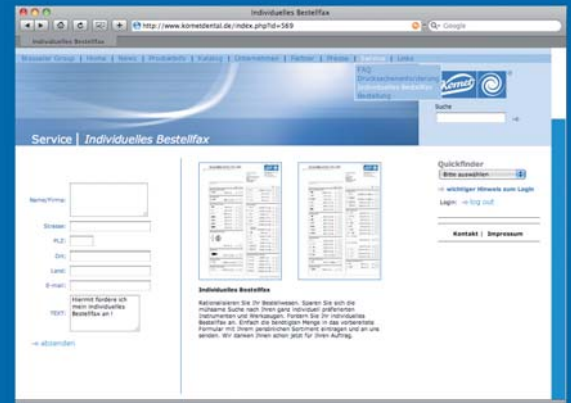
Abb. 3: Wer für die Bevorratung der Zahnarztpraxis verantwortlich ist, weiß die Zusammenfassung der TOP 50 Bestell-Liste zu schätzen.