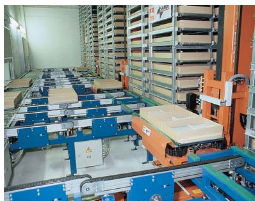
Abb. 4: Unter www.kometdental.de bei „Service“ einfach auf „Bestellung“ klicken: Ist der Auftrag online abgeschickt, können Sie sich regelmäßig binnen 48 Stunden auf ein Päckchen von KOMET freuen.

Wer KOMET-Produkte kauft, muss nicht den Umweg über den Dentalhandel gehen. Ihr Fachberater betreut Sie individuell mit viel Know-how und Feingefühl, damit sich Ihr neues Praxiskonzept und Ihre Bedürfnisse in den KOMET-Instrumenten widerspiegeln.