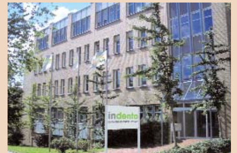
^ dent-net-Niederlassung in Essen.

Derzeit sind es bundesweit insgesamt ca. 17,7 Millionen Versicherungsnehmer, wobei die Krankenkassen und Praxen zum Teil unterschiedliche dent-net®-Module anbieten. Grundsätzlich können dazu folgende Leistungen zählen: Deutlich kostenreduzierter Zahnersatz und zuzahlungsfreie Regelversorgungen sowie fallweise bis zu zweimal jährlich die zuzahlungsfreie Prophylaxe. Durch die Zusammenarbeit mit dem Implantatanbieter implant direct™ und ausgewählten implantierenden Praxen können auch Implantatversorgungen mit erheblichen Kosteneinsparungen in Anspruch genommen werden.