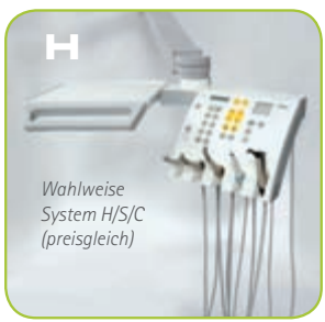
Wahlweise System H/S/C (preisgleich)