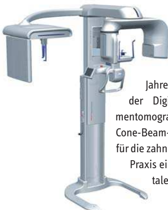
Das PaX-Uni3D von orangedental besteht aus einem Volumentomografen, der einen 3-D-Datensatz mit einem Volumen von 50 x 50 mm aufnimmt, einem OPG mit einem separaten 2-D-Sensor und einem one-shot CEPH mit einem großflächigen Flat-Panel-Sensor (264 x 325 mm).

und Dental-CTs zu generieren. In den vergangenen Jahren hat sich mit der Digitalen Volumentomografie (DVT, Cone-Beam-CT) speziell für die zahnmedizinische Praxis ein neues dentales Volumen-