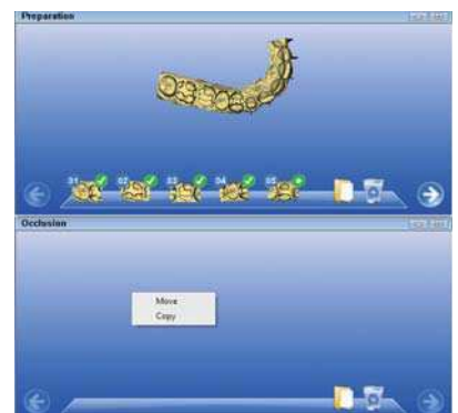
Das Aufnahmeformat \varnothing 80 x H 80 mm des 3D Accutomo von J. Morita erlaubt die Darstellung des kompletten Mundraums.

Die auf dem Markt befindlichen Geräte unter-