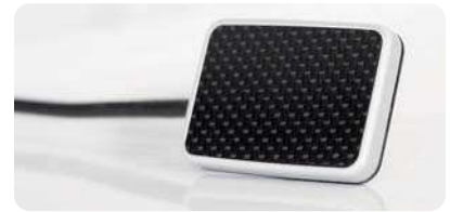
Die Sensoren IQ-C von Dürr Dental aus Carbon sind angenehm für den Patienten und liefern ein detailreiches und gut diagnostizierbares Bild.

Das absolute Ziel in dieser Art von Diagnostik und Therapie ist natürlich die Verbindung von 3-D-Röntgen und 3-D-Abtastung: Der virtuelle Patient. Welche mannigfaltigen Möglichkeiten sich dadurch dem Zahnarzt/Zahn-techniker erschließen werden, kann heute noch nicht einmal annäherungsweise geschätzt werden.