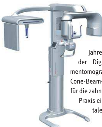
Das PaX-Uni3D von orangedental besteht aus einem Volumentomografen, der einen 3-D-Datensatz mit einem Volumen von 50 x 50 mm aufnimmt, einem OPG mit einem separaten 2-D-Sensor und einem one-shot CEPH mit einem großflächigen Flat-Panel-Sensor (264 x 325 mm).

und Dental-CTs zu generieren. In den vergangenen Jahren hat sich mit der Digitalen Volumentomografie (DVT, Cone-Beam-CT) speziell für die zahnmedizinische Praxis ein neues dentales Volumen-