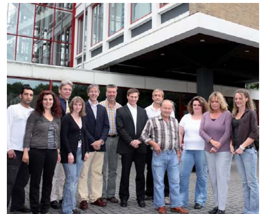
Das Semperdent-Team trägt maßgeblich zum Erfolg des Unternehmens bei. Hier kennt jeder Mitarbeiter alle Kunden.

perdent inklusive Hin- und Rückflug, Hotel, Fortbildungsveranstaltung, Sightseeing- und Wellness-Programm sowie sieben Hin- und Rückflüge nach Hongkong mit der Möglichkeit, an der Fortbildungsveranstaltung teilzunehmen.