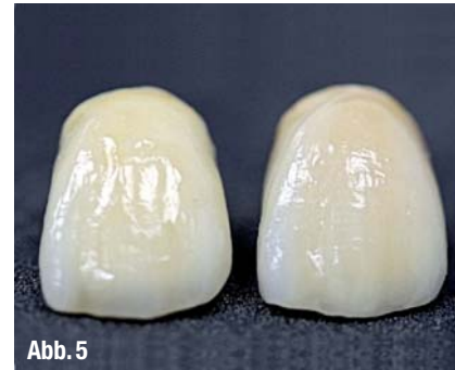
▲ Abb. 3 und 4: Erster Versuch mit einer „Two-in-one-Masse“ auf einem rein weißem CAD/CAM-gefertigtem Zirkongerüst von labial und von palatinal: Ein zufriedenstellendes Ergebnis nach dem ersten Dentinbrand. Die Oberfläche wurde hier nur mit Glasurflüssigkeit benetzt. ▲ Abb. 5: Zwei verschiedene Gerüstmaterialien, eine Verblendkeramik in der Gegenüberstellung (links Zirkon, rechts Titan).

kommen weitere Verbesserungen im Schichtungsverhalten und der Brennstabilität, sodass die modernen Massen insgesamt noch anwenderfreundlicher sind. Frei nach dem Motto „simplify your ceramic systems“ werden die Sortimente wieder einfacher und übersichtlicher.