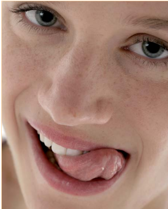
▲ Für Frauen ist die Optik von Zahnersatz wichtiger als für Männer.

Schöne und gesunde Zähne stehen sowohl bei Männern als auch bei Frauen in der Beurteilung der Attraktivität eines Menschen auf den ersten Plätzen. Muss für die Zähne Ersatz her, bietet die neue Zahntechnik eine Vielzahl von verschiedenen Materialien, die die Natur in Funktion, Technik und Ästhetik nahezu perfekt nachahmen. Steht laut einer Studie der Deutschen Gesellschaft für Zahnärztliche Prothetik und Werkstoffkunde (DGZPW) für Männer bei ihren Zähnen und ihrem Zahnersatz vor allem die richtige Funktion im Vordergrund, entscheidet bei Frauen vor allem die Optik, ob sie sich mit den „neuen“ Zähnen wohlfühlen.