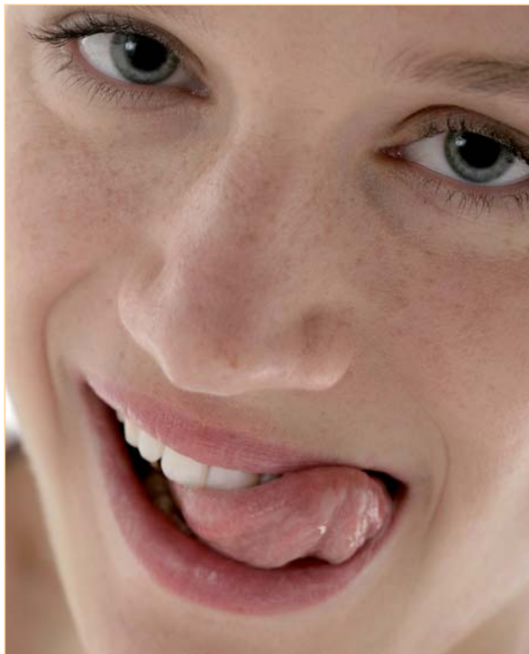
▲ Für Frauen ist die Optik von Zahnersatz wichtiger als für Männer.

Schöne und gesunde Zähne stehen sowohl bei Männern als auch bei Frauen in der Beurteilung der Attraktivität eines Menschen auf den ersten Plätzen. Muss für die Zähne Ersatz her, bietet die neue Zahntechnik eine Vielzahl von verschiedenen Materialien, die die Natur in Funktion, Technik und Ästhetik nahezu perfekt nachahmen. Steht laut einer Studie der Deutschen Gesellschaft für Zahnärztliche Prothetik und Werkstoffkunde (DGZPW) für Männer bei ihren Zähnen und ihrem Zahnersatz vor allem die richtige Funktion im Vordergrund, entscheidet bei Frauen vor allem die Optik, ob sie sich mit den „neuen“ Zähnen wohlfühlen.