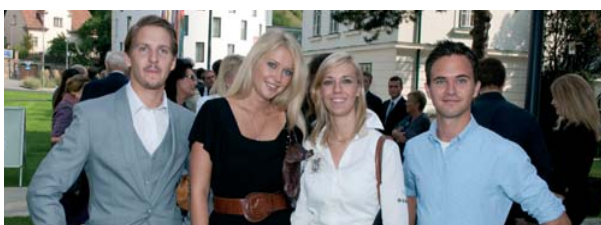
Die erste Studiengruppe der DPU startete am 21. September 2009.

Das Dental Excellence-Studium ist vom Österreichischen Akkreditierungsrat (ÖAR) akkreditiert, europaweit anerkannt, entspricht voll in allen Punkten den europäischen Bildungsrichtlinien. Mit besonders praxisorientierter Betreuung durch hoch angesehene Wissenschaftler, von 2.000 universitär weitergebildeten praktizierenden Zahnärzten/-innen evaluiert, wird höchster Bildungsanspruch erfüllt. Die Danube Private University (DPU) bildet junge Studierende zu exzellenten Zahnärzten/-innen aus, deren Praxen sich mit „State of the Art“ bei den Patienten auszeichnen. Außerdem bieten wir mit dem