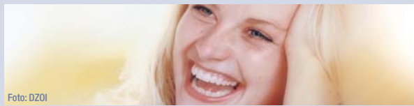
Das DZOI arbeitet konsequent an einem professionellen Kommunikationskonzept.