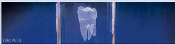
Der Forschungswettbewerb VOCO Dental Challenge 2010 wird zum 8. Mal veranstaltet.