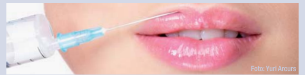
Die Schweizer Firma Teoxane führte einen Workshop zu Faltenunterspritzung mit Hyaluron durch.