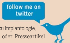
„Follow me on twitter“ heißt es auf der DZOI-Website.

Ein weiterer Baustein im Kommunikationsmix des DZOI ist „Twitter“. Unter der Adresse http://twitter.com/DZOI_News können interessierte Zahnmediziner Neuheiten in Kurzform abrufen. Ob Termine von Fortbildungen, Statements zu Implantologie, Laser-News oder Presseartikel zu aktuellen Themen der