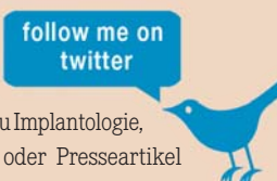
„Follow me on twitter“ heißt es auf der DZOI-Website.

Ein weiterer Baustein im Kommunikationsmix des DZOI ist „Twitter“. Unter der Adresse http://twitter.com/DZOI_News können interessierte Zahnmediziner Neuheiten in Kurzform abrufen. Ob Termine von Fortbildungen, Statements zu Implantologie, Laser-News oder Presseartikel zu aktuellen Themen der