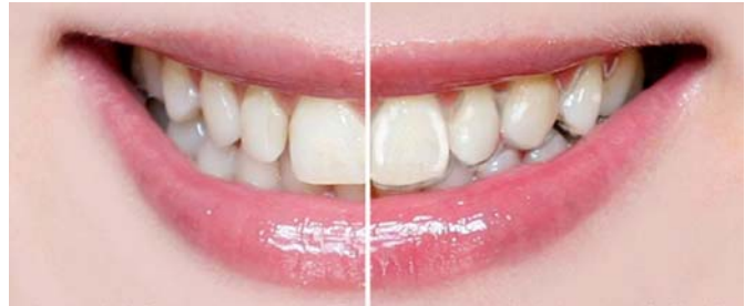
Die HarmonieSchiene® fällt nicht auf, links ohne, rechts mit Schiene.

Die erste Schiene tragen sie drei Wochen, alle nachfolgenden zwei Wochen. Hergestellt werden die Therapieschienen im deutschen Fachlabor Orthos, das eine zeitnahe Anfertigung garantiert. Dank einer eigenen auf die HarmonieSchiene spezialisierte Fachabteilung werden behandelnde Zahnärzte persönlich betreut und erhalten eine individuelle Fallplanung sowie Beratungen während der gesamten Behandlungsphase.