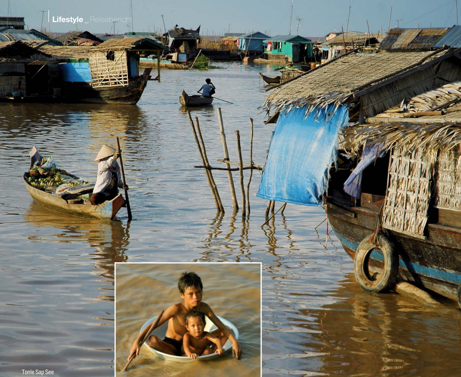
Tonle Sap See