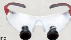
TTL-Galilei: 2,5-fache Vergrößerung

schaften (Helligkeit, Sehfeld, Schärfentiefe) die professionellen Leistungen deutlich steigern. Das Prismen- oder Kepler-System weist eine noch höhere optische Qualität auf und ermöglicht dem Behandler, auch die kleinsten Einzelheiten im Arbeitsfeld zu beobachten.