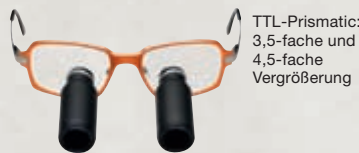
TTL-Prismatic: 3,5-fache und 4,5-fache Vergrößerung

Die TTL-Lupenbrillen sind als Galilei-System oder nach Keplerscher Bauart erhältlich. Bereits mit einer TTL-Brille Galileischer Bauart lassen sich durch die guten Produkteigen-