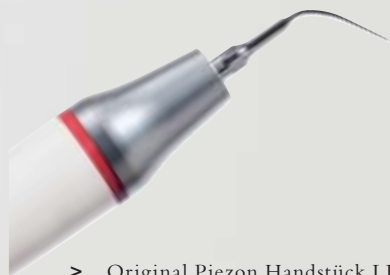
> Original Piezon Handstück LED mit EMS Swiss Instrument PS

Praktisch keine Schmerzen für den Patienten und maximale Schonung des oralen Epitheliums – grösster Patientenkomfort ist das überzeugende Plus der Original Methode Piezon, neuester Stand. Zudem punktet sie mit einzigartig glatten Zahnoberflächen. Alles zusammen ist das Ergebnis von linearen, parallel zum Zahn verlaufenden Schwingungen der Original EMS Swiss Instruments in harmonischer Abstimmung mit dem neuen Original Piezon Handstück LED.