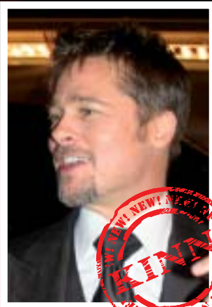
Brad Pitt