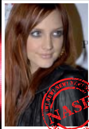
Ashlee Simpson