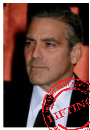
George Clooney