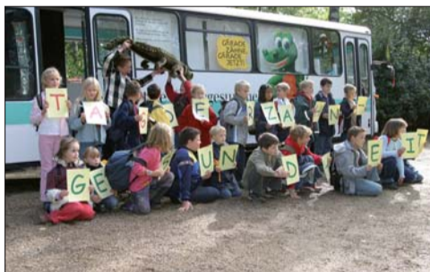
Der mobile Info- und Aktionsbus war bei vielen Tag-der-Zahngesundheit-Veranstaltungen dabei. Im KROCKY-MOBIL wird deutlich, dass Mundgesundheit mehr bedeutet als ausschließlich „Zahngesundheit“.

Bereits Anfang des Jahres war das KROCKY-MOBIL der Initiative Kiefergesundheit (IKG) für die Tourenzeiten 2010 so gut wie ausgebucht. Nur noch vereinzelte Termine stehen zur Verfügung. Und selbst für 2011 ist der Buchungskalender schon gut gefüllt. Das KROCKY-MOBIL bietet kieferorthopädische Aufklärung für jede Altersstufe und wird von Arbeitsgemeinschaften für Jugendzahnpflege, von Krankenkassen, Gesundheitsämtern und insbesondere von Fachzahnärzten für KFO für Informationsaktionen genutzt.