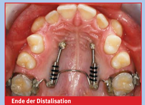
Ende der Distalisation