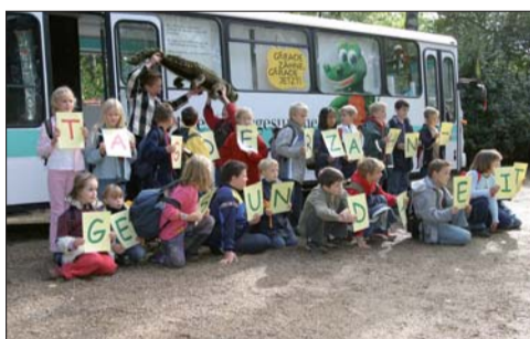
Der mobile Info- und Aktionsbus war bei vielen Tag-der-Zahngesundheit-Veranstaltungen dabei. Im KROCKY-MOBIL wird deutlich, dass Mundgesundheit mehr bedeutet als ausschließlich „Zahngesundheit“.

Bereits Anfang des Jahres war das KROCKY-MOBIL der Initiative Kiefergesundheit (IKG) für die Tourenzeiten 2010 so gut wie ausgebucht. Nur noch vereinzelte Termine stehen zur Verfügung. Und selbst für 2011 ist der Buchungskalender schon gut gefüllt. Das KROCKY-MOBIL bietet kieferorthopädische Aufklärung für jede Altersstufe und wird von Arbeitsgemeinschaften für Jugendzahnpflege, von Krankenkassen, Gesundheitsämtern und insbesondere von Fachzahnärzten für KFO für Informationsaktionen genutzt.