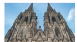
KÖLN 08. Dezember 2010