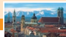
MÜNCHEN 20. Oktober 2010