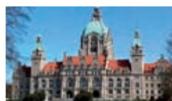
HANNOVER 03. November 2010