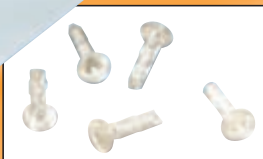
Membrane und Pins aus PDLLA