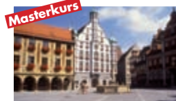
Masterkurs MEMMINGEN 19.-20. November 2010