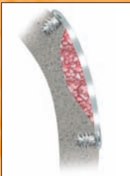
Schalentechnik mit 0,1 mm PDLLA-Folie

„Ich arbeite nun seit einem Jahr mit der Schalentechnik. In diesem Zeitraum wurde von mir kein Knochenblock mehr eingesetzt.“