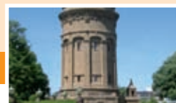
MANNHEIM 16. Juni 2010