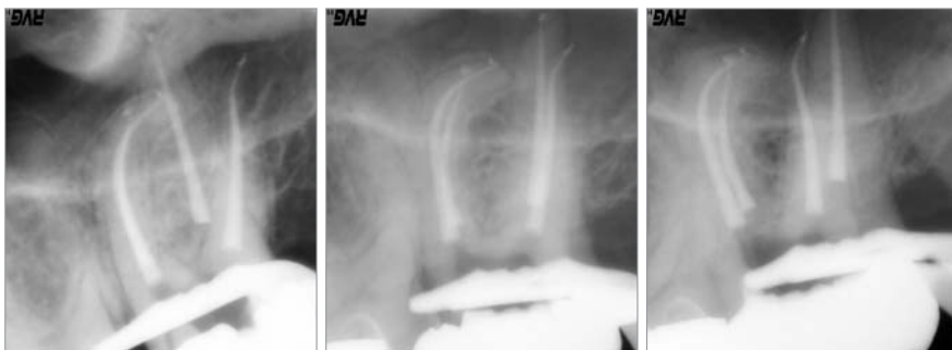
Abb. 11: Röntgenkontrolle der Wurzelfüllung aus mesialexzentrischer Projektionsrichtung. – Abb. 12: Röntgenkontrolle der Wurzelfüllung aus orthoradialer Projektionsrichtung. – Abb. 13: Röntgenkontrolle der Wurzelfüllung aus distalexzentrischer Projektionsrichtung.

che Vorgehen ist mit ultraschallaktivierten Instrumenten möglich. Um in fraglichen Situationen die Orientierung in der Wurzel zu gewährleisten und eine Perforation zu vermeiden, ist eine radiologische Darstellung der bisher geleisteten mechanischen Aufbereitung sinnvoll. Hierfür bietet sich das Einbringen von Röntgenkontrastmittel aus der Radiologie oder von erwärmter Guttapercha an.