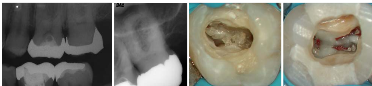
Abb. 1: Dentinablagerungen am Pulpakammerdach und am Pulpakammerboden an Zahn 27. – Abb. 2: In der Folgezeit vollständig obliteriertes Wurzelkanalsystem an Zahn 27 aus Abbildung 1. – Abb. 3: Am Pulpakammerboden anhaftender Dentikel. – Abb. 4: Dentikel in allen Wurzelkanälen des Kanalsystems.