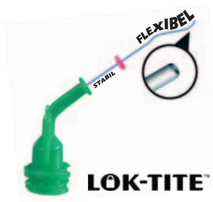
Mit Beflockung zur Reinigung der Kanalwände NaviTips FX / Ø 0,30 mm