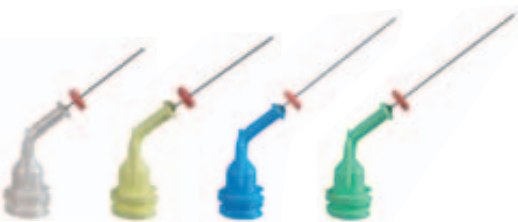
Für die Applikation von Pasten NaviTips 29 ga / Ø 0,33 mm