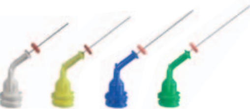
Für die Applikation von Gelen und Flüssigkeiten NaviTips 30 ga / Ø 0,30 mm