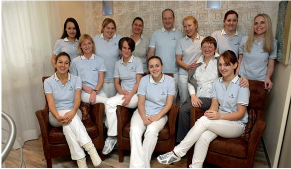
Für das Praxisteam stehen Professionalität und Respekt an erster Stelle.