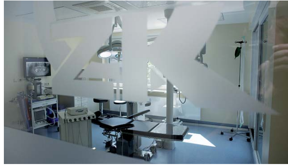
Auf eine weitere implantologische Spezialisierung ist die Praxis gut vorbereitet. Hier: der Eingriffsraum der ZK Zahnkonzept GmbH.

vergleichbaren Praxiseinnahmen ausgerichtet." Und mit einem Augenzwinkern fügt er hinzu: „Prima wäre auch ein Einnahmen-Benchmarking.“