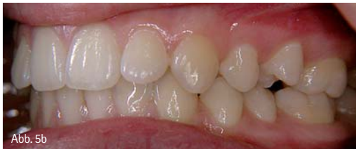
Abb. 5a: Einzelzahnkreuzbiss. – Abb. 5b: Einzelzahnscherenbiss.

zur Abschirmung der Unterkiefer-Basis gegen den Zungendruck modifiziert haben (Abb. 8). Die Fränkelsche Originalausführung des FR III sieht eine Wangenpelotte für beide Kiefer vor, die im Oberkiefer 2 mm vom Zahnbogen abliegt, während sie im Unterkiefer anliegt (Abb. 9). In unserer Modifikation wurde die Unterkieferpelotte nach lingual verlagert, liegt nicht an, schirmt den unteren Zahnbogen gegen die Zunge ab und unterstützt die Positionierung der Zunge im Gaumendach. Das Fränkelsche Prinzip beruht auf dem Anregen von Wachstumsvorgängen durch Kno-