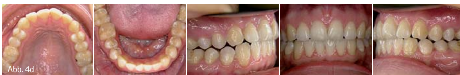
Abb. 4d: Seitlich offener Biss als Ausdruck einer Dekompression der Kiefergelenke nach Schienentherapie.

Während die kieferorthopädische Deckbissstherapie nach Abschluss der frühen Wechselgebissphase beginnen sollte, also etwa im Alter von sieben bis neun Jahren sobald die permanenten Frontzähne durchgebrochen sind, sollte die Kreuzbissbehandlung so früh wie möglich beginnen. 9 Für die frühe Deckbissstherapie haben sich skelettal wirksame funktionskieferorthopädische Ansätze mit herausnehmbaren Geräten wie z.B. mit dem Funktionsregler II nach Fränkel (Abb. 6) oder auch mit verschiedenen Aktivator-Modifikationen bewährt, während die Kreuzbissbehandlung mit einer transversalen und sagittalen skelettalen Nachentwicklung der OK-Basis durch Einsatz einer festsitzenden Gaumennahterweiterungsapparatur (GNE) beginnen sollte (Abb. 7), nach deren Entfernung oft ein spontanes Ausschwenken des Unterkiefers beobachtet wird. Die Dehnungsphase beträgt meist nur zwei Wochen, das Gerät bleibt dann noch weitere drei Monate in situ, um eine Remodellation der Gaumennaht zu ermöglichen. Wichtig ist dabei das Erreichen einer echten skelettalen Erweiterung. Deswegen ist die gegossene GNE allen anderen festsitzenden und herausnehmbaren Dehnapparaturen, die eine vorwiegend dentale Bukkalkippung der oberen Seitensegmente in der unverändert schmalen Oberkieferbasis bewirken, 12 überlegen. Retiniert wird hier mit einem Funktionsregler Typ III, den wir