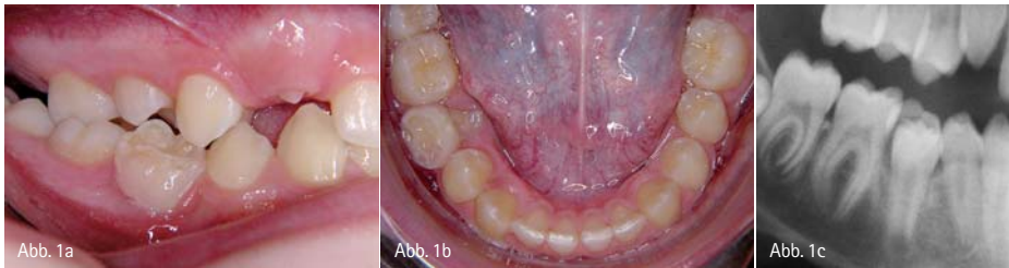
Abb. 1a–c: Physiologische Okklusionsstörung im Zahnwechsel. – Abb. 1a–b: Intraorale Situation. Der Milchzahn 85 wird durch den nachfolgenden Zahn 45 verdrängt. – Abb. 1c: Röntgensituation. Man erkennt den wurzellosen Milchzahn 85, der dem nachfolgenden Zahn 45 als Kappe aufsitzt.

In der Kieferorthopädie werden derzeit von verschiedenen Autoren folgende strukturelle Abweichungen von der Norm als Risikofaktoren zur Begünstigung einer CMD angesehen: geringer Gelenkbahn-Okklusionsebenenwinkel, Trauma, Deckbiss, Rezidiv einer kieferorthopädischen Behandlung z.B. infolge kieferorthopädischer Überexpansion, Rezidive von kieferorthopädischer Wachstumshemmung des Unterkiefers mit Kopf-Kinn-Kappen bei Jugendlichen oder Rezidive von kieferorthopädischen Unterkieferverlagerungen nach überschrittenem Wachstumsmaximum, infolgedessen oder unabhängig hiervon entstandener Zwangsbiss, fehlende posteriore Abstützung, offener Biss. 5 Man muss diese strukturellen Störungen in prothetisch und kieferorthopädisch relevante sowie in physiologische und pathologische Störungen unterteilen.