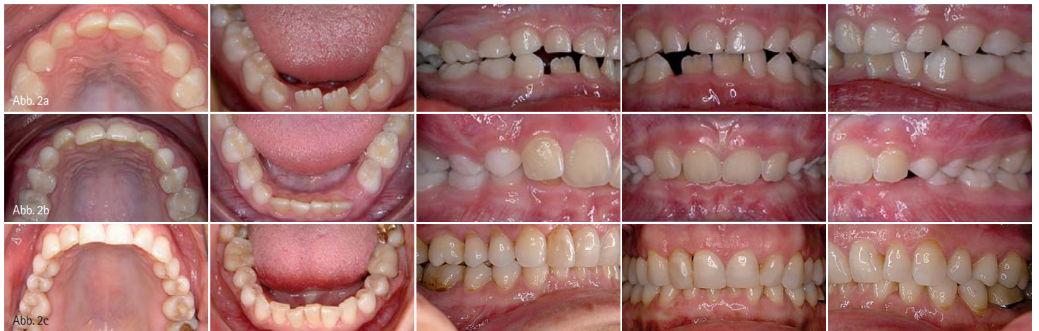
Abb. 2a: Deckbiss im Milchgebiss (man erkennt die umfangreichen Abrasionen an den oberen Milchfrontzähnen und die beginnende Engstellung der bleibenden unteren Frontzähne). – Abb. 2b: Deckbiss im frühen Wechselgebiss intraoral. – Abb. 2c: Deckbiss im permanenten Gebiss.