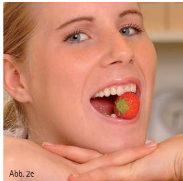
Abb. 2e: Der Deckbiss wird oft als ästhetisch ansprechend empfunden.

mata müssen abhängig vom Lebensalter, in dem sie entstehen, therapiert werden. Ein geringer Gelenkbahn-Oklusionsebenenwinkel ist abhängig vom Wachstumsmuster 3 und damit nur in früher Kindheit therapeutisch relevant zu beeinflussen (Clark, 2007).