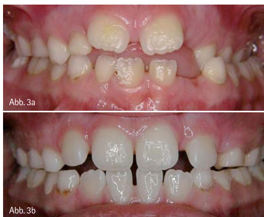
Abb. 3a: Kreuzbiss mit linkslateraler Unterkieferzwangposition im frühen Wechselgebiss bei einem sechsjährigen Jungen. – Abb. 3b: Derselbe Patient nach kieferorthopädischer Frühbehandlung, 1,5 Jahre später.

Der Deckbiss ist bereits im Milchgebiss gekennzeichnet durch eine mehr oder weniger stark ausgeprägte Rückwärtskipfung der oberen Frontzähne mit einer Tiefbiss-Situation, die sich auf das bleibende Gebiss überträgt. Häufig ist diese Anomalie mit einer Hyperplasie der Oberkieferbasis vergesellschaftet. Erbliche Faktoren werden diskutiert. Der Kreuzbiss hat dagegen häufig funktionelle Ursachen, z.B. ein persistentes viszerales Schluckmuster oder eine kaudale Zungenlage, diese wiederum häufig aufgrund einer eingeschränkten Nasenatmung. Die tiefe Zungenlage führt zu einem funktionellen Ungleich-