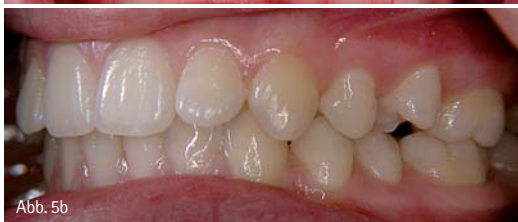
Abb. 5a: Einzelzahnkreuzbiss. – Abb. 5b: Einzelzahnscherenbiss.

zur Abschirmung der Unterkiefer-Basis gegen den Zungendruck modifiziert haben (Abb. 8). Die Fränkelsche Originalausführung des FR III sieht eine Wangenpelotte für beide Kiefer vor, die im Oberkiefer 2 mm vom Zahnbogen abliegt, während sie im Unterkiefer anliegt (Abb. 9). In unserer Modifikation wurde die Unterkieferpelotte nach lingual verlagert, liegt nicht an, schirmt den unteren Zahnbogen gegen die Zunge ab und unterstützt die Positionierung der Zunge im Gaumendach. Das Fränkelsche Prinzip beruht auf dem Anregen von Wachstumsvorgängen durch Kno-