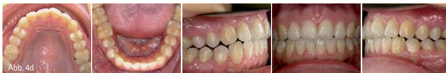
Abb. 4d: Seitlich offener Biss als Ausdruck einer Dekompression der Kiefergelenke nach Schienentherapie.

Während die kieferorthopädische Deckbissstherapie nach Abschluss der frühen Wechselgebissphase beginnen sollte, also etwa im Alter von sieben bis neun Jahren sobald die permanenten Frontzähne durchgebrochen sind, sollte die Kreuzbissbehandlung so früh wie möglich beginnen. 9 Für die frühe Deckbissstherapie haben sich skelettal wirksame funktionskieferorthopädische Ansätze mit herausnehmbaren Geräten wie z.B. mit dem Funktionsregler II nach Fränkel (Abb. 6) oder auch mit verschiedenen Aktivator-Modifikationen bewährt, während die Kreuzbissbehandlung mit einer transversalen und sagittalen skelettalen Nachentwicklung der OK-Basis durch Einsatz einer festsitzenden Gaumennahterweiterungsapparatur (GNE) beginnen sollte (Abb. 7), nach deren Entfernung oft ein spontanes Ausschwenken des Unterkiefers beobachtet wird. Die Dehnungsphase beträgt meist nur zwei Wochen, das Gerät bleibt dann noch weitere drei Monate in situ, um eine Remodellation der Gaumennaht zu ermöglichen. Wichtig ist dabei das Erreichen einer echten skelettalen Erweiterung. Deswegen ist die gegossene GNE allen anderen festsitzenden und herausnehmbaren Dehnapparaturen, die eine vorwiegend dentale Bukkalkippung der oberen Seitensegmente in der unverändert schmalen Oberkieferbasis bewirken, 12 überlegen. Retiniert wird hier mit einem Funktionsregler Typ III, den wir