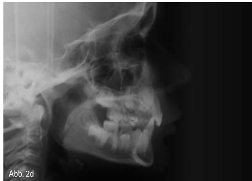
Abb. 2d: Dieselbe Patientin aus Abbildung 2b, Fernröntgenseitbild. Man erkennt die tiefe Frontverzahnung und die steil stehende HWS.