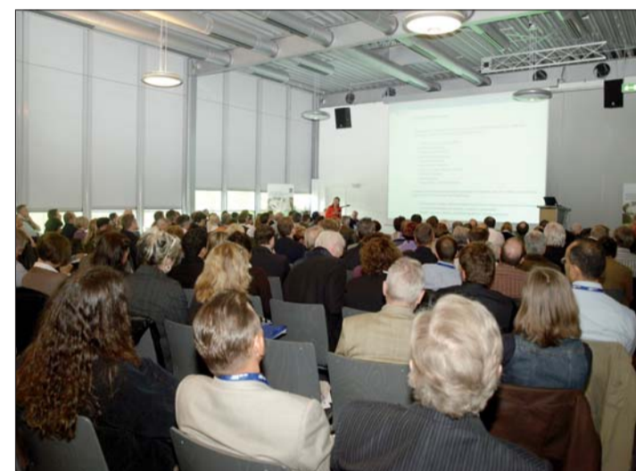
Das Mainpodium erfreute sich einer großen Zuhörerschaft.