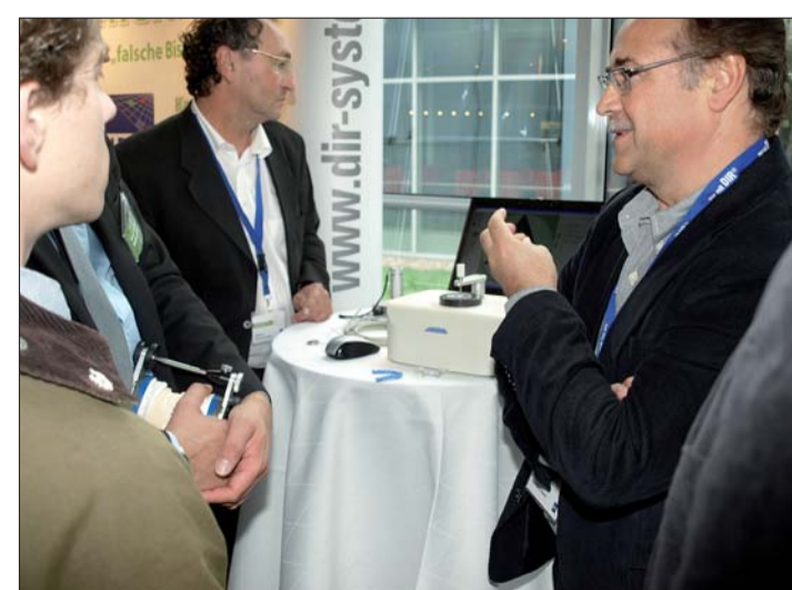
Im Ausstellungsbereich konnten die Teilnehmer sich austauschen.