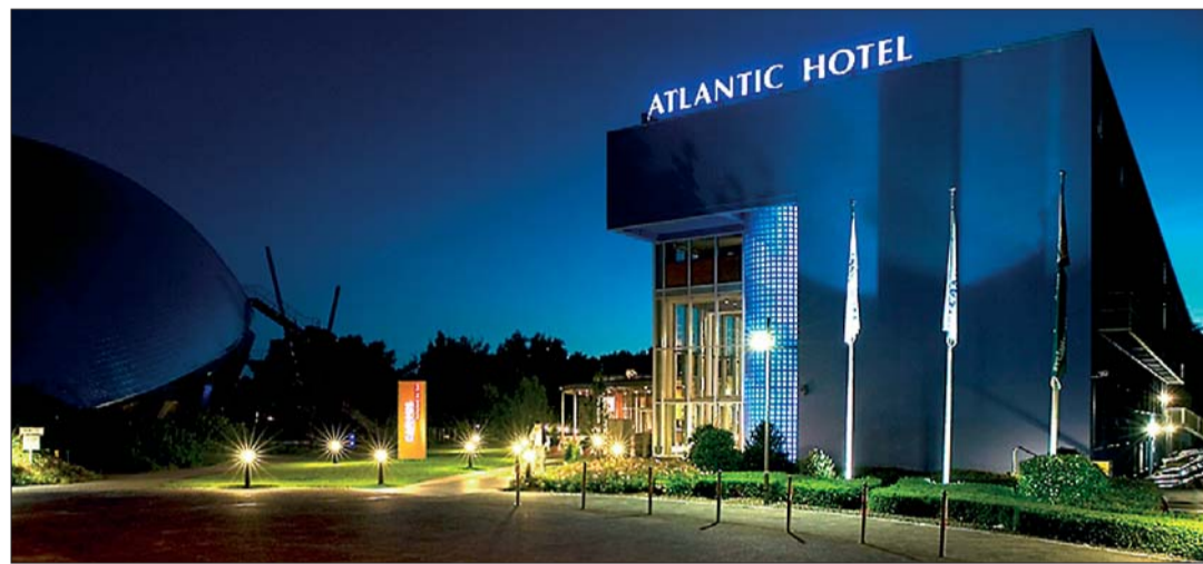
Die Veranstaltung fand im Bremer Atlantic Hotel Universum statt.