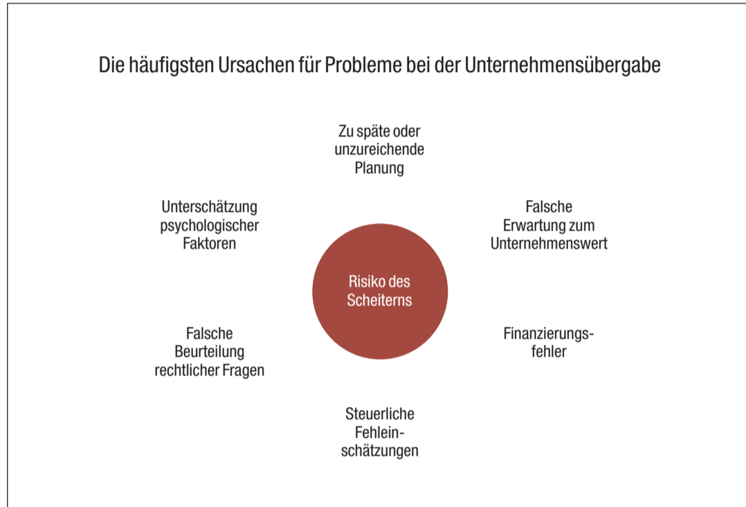
Abb. 1: Probleme bei der Unternehmensnachfolge.