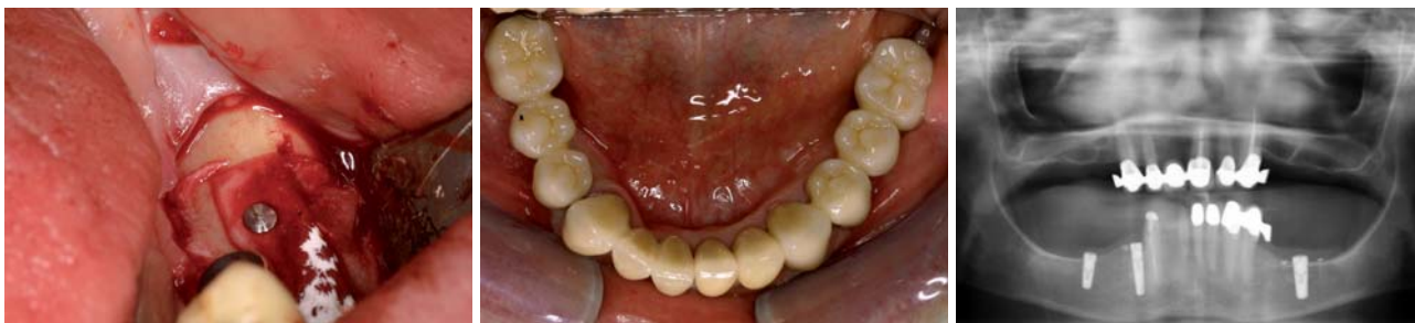
Abb. 12: Abdeckung mit einer Kollagenmembran. – Abb. 13: Zustand nach prothetischer Versorgung. – Abb. 14: Röntgenkontrolle.

Implantatüberlebensraten zeigen ähnlich hohe Werte wie bei Standardimplantationen. Demgegenüber steht die schwierige Operationstechnik, die einen erfahrenen Operateur voraussetzt, sowie das Risiko einer Nervirritation gegenüber. Die Patienten müssen von einer ca. sechs- bis achtwöchigen Parästhesie des N. mentalis ausgehen, eine dauerhafte Parästhesie kann nicht ausgeschlossen werden. Aus diesem Grunde ist eine ausführliche Aufklärung des Patienten von entscheidender Bedeutung. Als seltene Komplikation wird die Fraktur des Unterkiefers im Bereich des Knochenfensters beschrieben. Bei den elf in der Praxis des Autors durchgeführten Nervverlagerungsoperationen kam es in zehn Fällen zu einer vollständigen Wiederherstellung der Funktion des N. mentalis innerhalb von sechs bis acht Wochen. In einem Fall trat eine dauerhafte Missempfindung, die