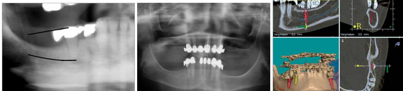
Abb. 1: Krestaler Verlauf des N. alveolaris inferior. – Abb. 2: OPG prä OP. – Abb. 3: Auswertung mithilfe der Med 3-D-Software.

Jensen und Nock publizierten 1987 erstmalig eine Technik zur Verlagerung des Foramen mentale. Bei dieser Technik wird der Austrittspunkt des N. alveolaris am Foramen mentale dargestellt. Unter Sicht und Schonung des Nervs wird das Foramen nach distal erweitert, sodass der Nerv weiter distal aus dem Kiefer nach bukkal austritt. Dadurch ist es möglich, Implantate in 5er- bzw. 6er-Position zu inserieren, ohne den Nerv zu verletzen. Eine weitere Operationstechnik besteht in der u.a. von Kan, Pelg und Ferrigno beschriebenen Lateralisation des Nervs distal des Foramen mentale. Bei dieser Technik, die in diesem Artikel genauer beschrieben wird, bleibt der N. alveolaris im Bereich des Foramen mentale unberührt. Es erfolgt distal des Foramens eine Fensterierung der