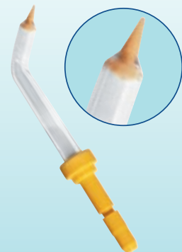
Subgingival-Düse PP-100 (PZN 354584 6)

Waterpik medizinische Mundduschen werden in Deutschland vertrieben von: