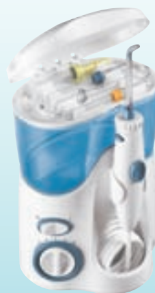
Waterpik Munddusche Ultra Professional WP-100E4 (PZN 641459 9)

Weitere wissenschaftliche Informationen, Lieferprogramm und Kundenprospekte fordern Sie bitte direkt bei der intersanté GmbH an.