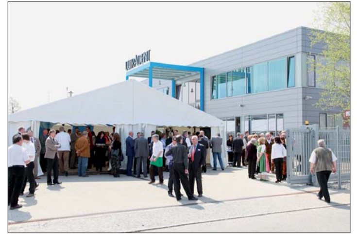
Die neue ULTRADENT-Firmenzentrale in Brunnthal.

Einweihung der neuen ULTRADENT-Firmenzentrale in Brunnthal.