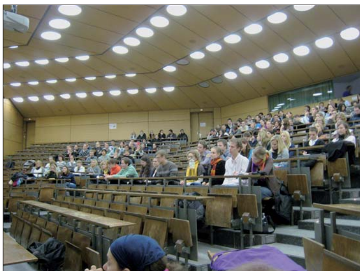
Die Projekte des BdZA richten sich an junge Zahnmediziner in Deutschland.

BdZA arbeitet an neuen Schwerpunktthemen und Projekten für junge Zahnmediziner.