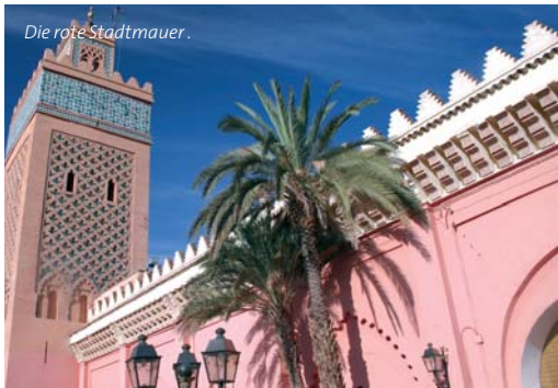
Die rote Stadtmauer.

Stadt überall am Horizont zu erkennen sind. Die rote Stadt, wie Marrakesch wegen der größtenteils rötlichen Bauten auch bezeichnet wird, gab dem Land Marokko einst seinen Namen und ist noch immer die heimliche Hauptstadt.