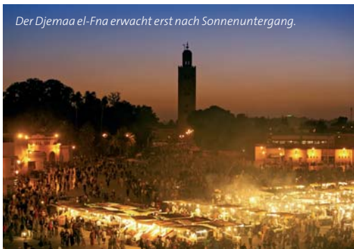
Der Djemaa el-Fna erwacht erst nach Sonnenuntergang.