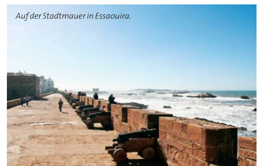
Auf der Stadtmauer in Essaouira.

lich wie Torremolinos in Spanien wurde es zum touristischen Wallfahrtsort der Blumenkinder. Es finden sich zwar nur noch wenige Spuren der außergewöhnlichen Gäste – doch der inspirierende Geist lebt noch immer in Essaouira.