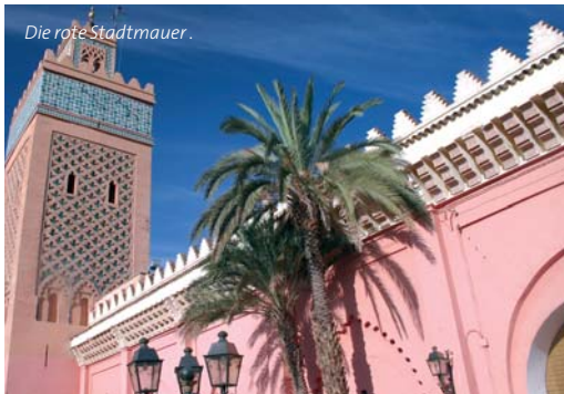
Die rote Stadtmauer.

Stadt überall am Horizont zu erkennen sind. Die rote Stadt, wie Marrakesch wegen der größtenteils rötlichen Bauten auch bezeichnet wird, gab dem Land Marokko einst seinen Namen und ist noch immer die heimliche Hauptstadt.