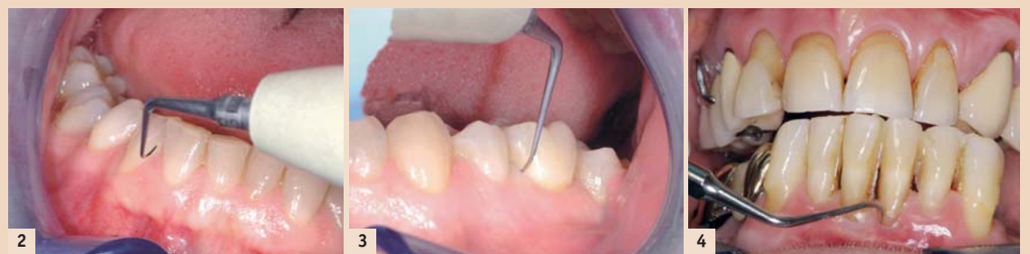
Abb. 2: Klinischer Fall, Dr. E. Normand (FR). P2L nach links ausgerichtet. Behandlung des vorderen Bereichs.

Das Perio Precision Kit mit den Mikrospitzen TK1-1S, P2L und P2R ist ab sofort in einer autoklavierbaren Box mit der von Satelec patentierten CCS-Farbmarkierung und drei grünen Drehmomentschlüsseln erhältlich – für eine kontrollierte und effiziente Spitzenleistung in der Zahnfleischtasche.