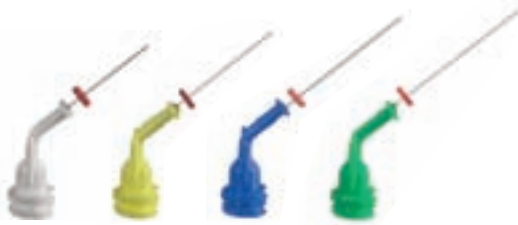
Für die Applikation von Gelen und Flüssigkeiten NaviTips 30 ga / Ø 0,30 mm