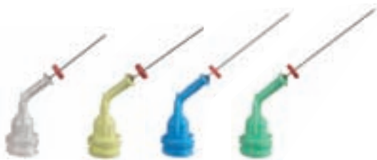
Für die Applikation von Pasten NaviTips 29 ga / Ø 0,33 mm