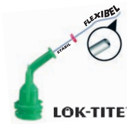
Mit Beflockung zur Reinigung der Kanalwände NaviTips FX / Ø 0,30 mm