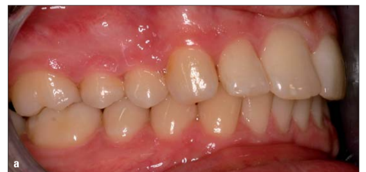
Abb. 10a, b: Kontrolle nach zwei Jahren.