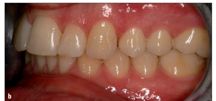
Abb. 11: Zwei Jahre nach Abschluss der aktiven Behandlung.