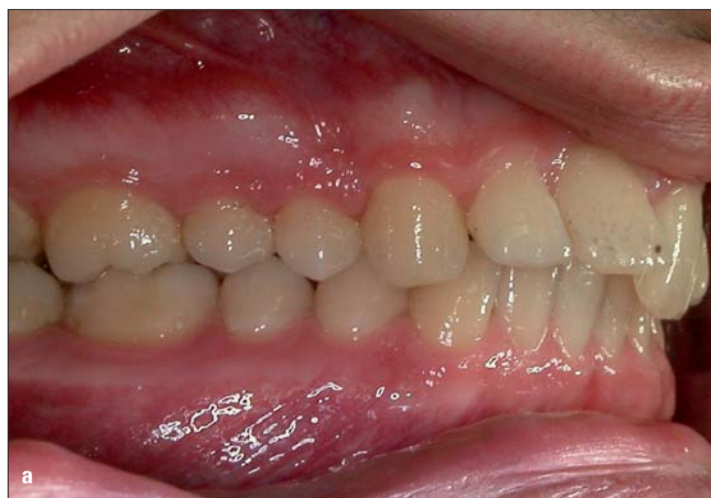
Abb. 2a, b: 21 Steilstand und elongiert.