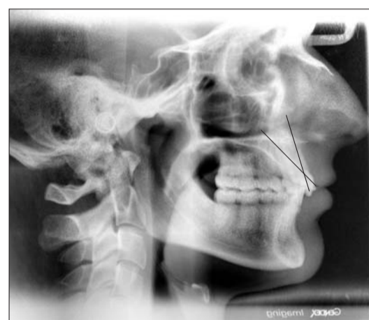
Abb. 3: Unterschiedliche Achsenneigung der Inzisivi.