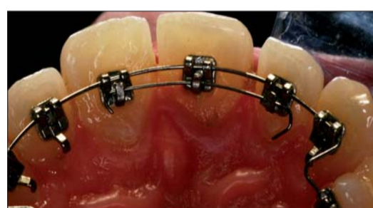
Abb. 8: Teilbogen eingegliedert.

sentierte sich deutlich verlängert und hatte im Verbund mit seinen Nachbarzähnen eine ungünstige Achsenneigung (Steilstand). Das Fernröntgenseitenbild