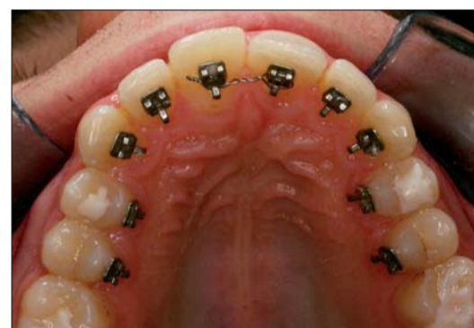
Abb. 5: 2D-Lingualapparat eingesetzt.