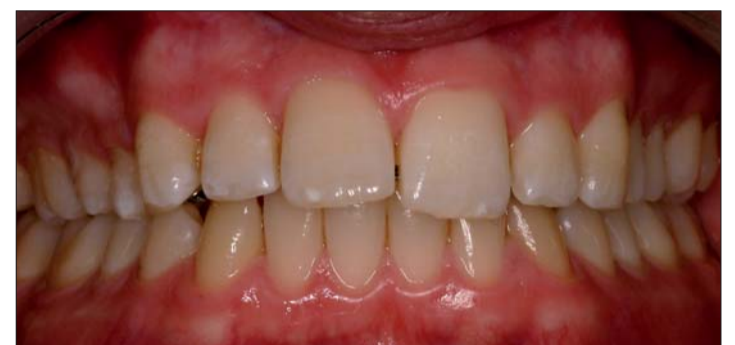
Abb. 9: Torque beginnt zu wirken.

Die zweidimensionale Behandlungsmethode ist eigentlich für leichtere kieferorthopädische Fälle gedacht. Benutzt man jedoch eine entsprechende biomechanische Vorrichtung, die ein Drehmoment erzeugen kann, gelingt es auch, Torque bis zu einem gewissen Umfang zu erhalten. An