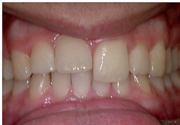
Abb. 1: Elongierter 21 nach Bruch des Retainers.

Rezidive im Frontzahnbereich nach abgeschlossener Multibandbehandlung sind keine Seltenheit. Meistens manifestieren sie sich in der Unterkieferfront. Gelegentlich sind auch die Oberkieferfrontzähne betroffen, so wie im vorliegenden Fall. Hier erfolgte die Korrektur mittels 2D-Lingualapparat. Von Dr. Jakob Karp.