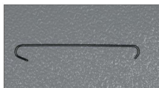
Abb. 7: Teilbogen aus Nickeltitanium.