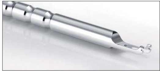
Mit dem neuen Quick-Bogeninstrument ist das Einlegen von Bögen noch einfacher und schneller möglich.

Auf der IDS präsentierte FORESTADENT eine Messeneuheit – ab sofort gibt es die QuicKlear®-Brackets von 5 bis 5 im Oberkiefer. Somit passt sich die Keramikvariante des bekannten und bewährten selbstligierenden Quick 2.0®-Systems noch makelloser an die natürliche Schönheit der Zähne an.