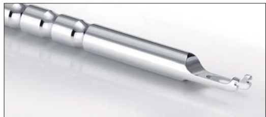
Mit dem neuen Quick-Bogeninstrument ist das Einlegen von Bögen noch einfacher und schneller möglich.

Auf der IDS präsentierte FORESTADENT eine Messeneinheit – ab sofort gibt es die QuicKlear®-Brackets von 5 bis 5 im Oberkiefer. Somit passt sich die Keramikvariante des bekannten und bewährten selbstligierenden Quick 2.0®-Systems noch makelloser an die natürliche Schönheit der Zähne an.