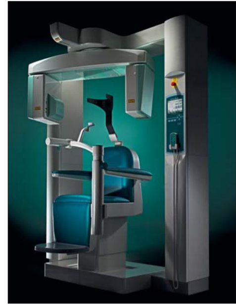
3D Accutomo 170: Hohes Auflösungsvermögen von Ø 40 x H 40 mm bis Ø 170 x H 120 mm.

Ab sofort sind vier weitere Aufnahmeformate mit der 170er-Version verfügbar.