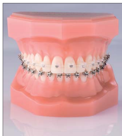
Jetzt auch von 5 bis 5 im OK erhältlich – die QuicKlear®-Brackets von FORESTADENT. Für eine rundum natürliche Optik und somit perfekte Ästhetik.

Chrom-Cobalt-Legierung gefertigt. Zwei integrierte Mechanismen garantieren dabei deren einfaches Öffnen und Schließen. Vor allem das Öffnen per Sonde