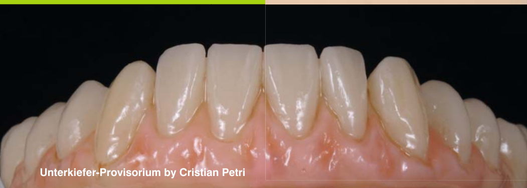
Unterkiefer-Provisorium by Cristian Petri