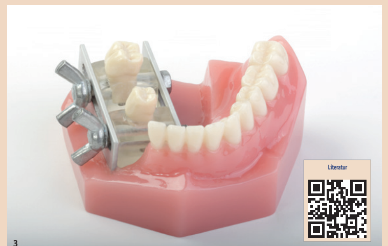
Abb. 3: Eigens konstruiertes Modell zur Erstellung individueller Approximalkontakte.

Instrumenten und Schallinstrumenten ( p < 0,001 ) sowie zwischen rotierenden Instrumenten und Ultraschallinstrumenten ( p < 0,001 ). Schall- und Ultraschallinstrumente unterschieden sich nicht signifikant ( p = 0,049 ). Rotierende Instrumente erzeugten den niedrigsten Medianwert von 1,61 µm (Interquartilsrange 1,36 µm–1,82 µm), gefolgt von Ultraschallinstrumenten mit 2,27 µm (2,11 µm–2,48 µm) und Schallinstrumenten mit 2,40 µm (2,32 µm–2,69 µm). Mikroleakage, marginaler Randspalt und approximaler Präparationsrandqualität unterschieden sich zwischen den Finiturmethode unerheblich. Tendenziell zeigten sich vermehrt Schmelzaussprengungen am basalen Präparationsrand in der Gruppe der Schallinstrumente. Es lagen keine Korrelationen zwischen Mikroleakage und marginalem Randspalt bzw. absoluter marginaler Diskrepanz sowie zwischen Mikroleakage und Oberflächenrauheit vor.