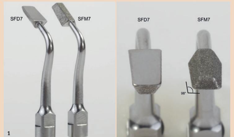
Abb. 1: Oszillierende Spitzen SFM7/SFD7 (Geb. Brasseler GmbH & Co. KG, Lemgo).