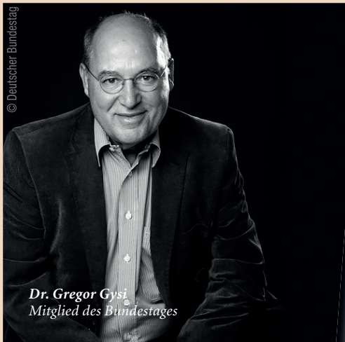
Dr. Gregor Gysi Mitglied des Bundestages

Am 4. und 5. Oktober 2019 findet in München der 2. Zukunftskongress für die zahnärztliche Implantologie der DGZI statt.