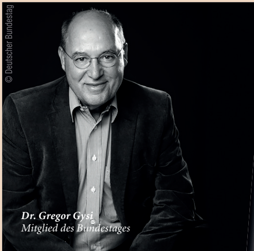
Dr. Gregor Gysi Mitglied des Bundestages

Am 4. und 5. Oktober 2019 findet in München der 2. Zukunftskongress für die zahnärztliche Implantologie der DGZI statt.