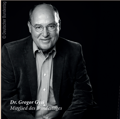
Dr. Gregor Gysi Mitglied des Bundestages

Am 4. und 5. Oktober 2019 findet in München der 2. Zukunftskongress für die zahnärztliche Implantologie der DGZI statt.