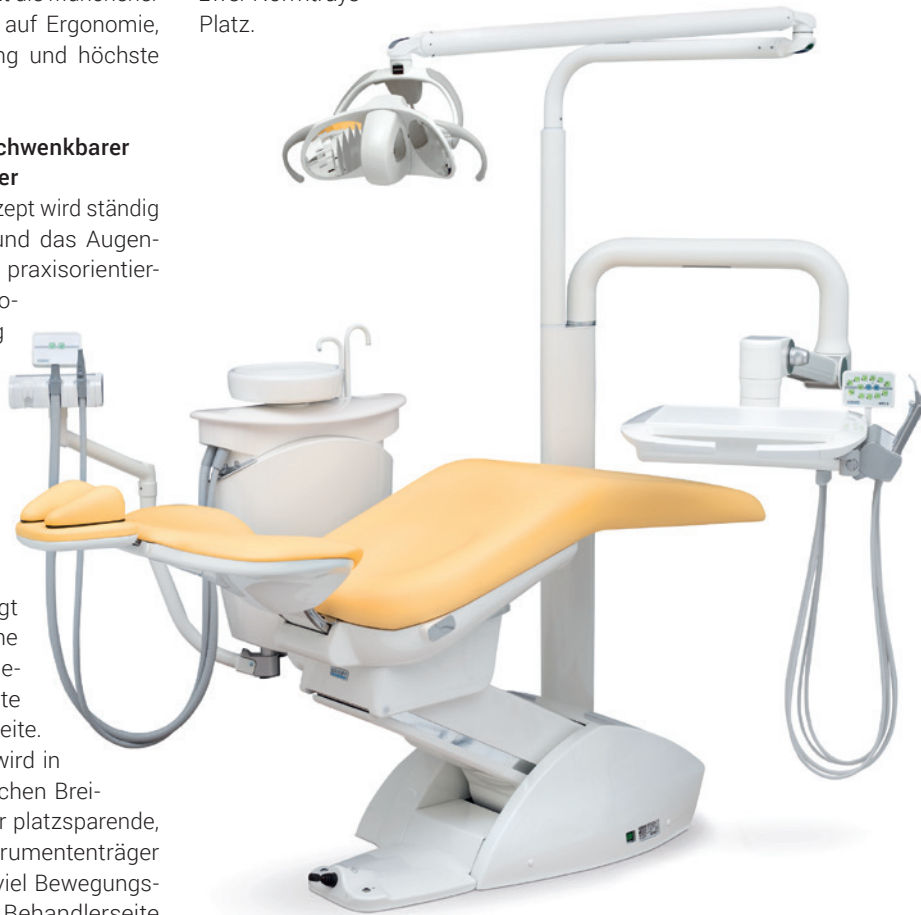
easy KFO 2 – einfach zuverlässig.

zensystem sorgt für angenehme und sichere Behandlung. Alle easy Einheiten sind mit der LED-Behandlungsleuchte Solaris 3 ausgestattet.