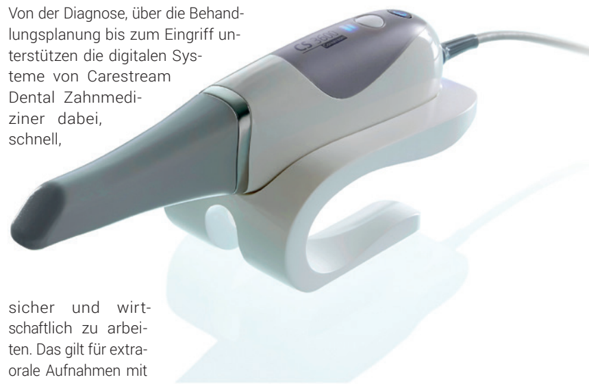
Intraoralscanner CS3600.

Von der Diagnose, über die Behandlungsplanung bis zum Eingriff unterstützen die digitalen Systeme von Carestream Dental Zahnmediziner dabei, schnell,