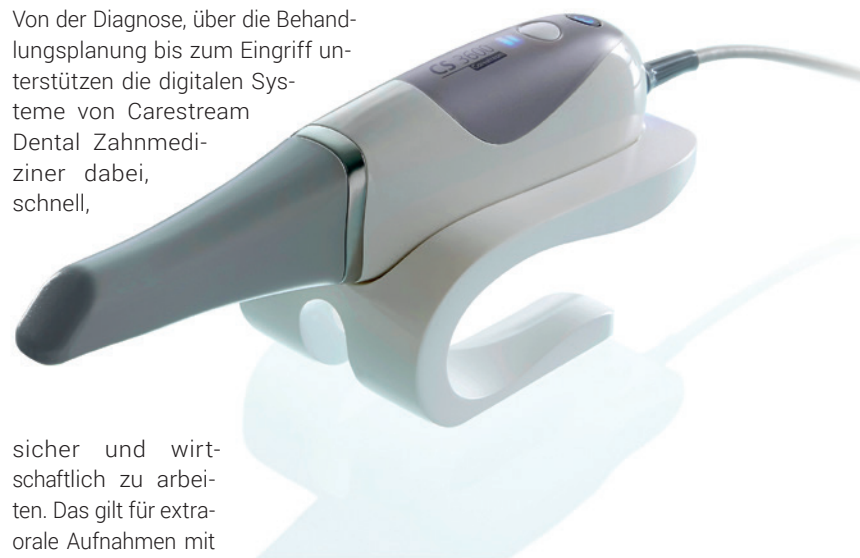
Intraoralscanner CS 3600.

Von der Diagnose, über die Behandlungsplanung bis zum Eingriff unterstützen die digitalen Systeme von Carestream Dental Zahnmediziner dabei, schnell,