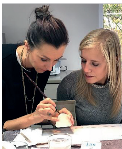
Abb. links: Dentsply Sirona WIN – 32 Frauen aus 16 Ländern starten das aktuelle zwölfmonatige Programm bei einer viertägigen Veranstaltung in Dallas, USA. Abb. rechts: The Woman Workshop in Berlin: Zahnärztinnen arbeiten mit Celtra Press und Celtra Ceram.