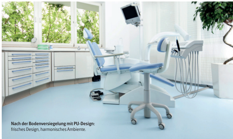
Nach der Bodenversiegelung mit PU-Design: frisches Design, harmonisches Ambiente.

das Verlegen eines neuen Bodenbelags ist eine äußerst zeit- und kostenaufwendige Angelegenheit. Ein neuralgischer Punkt sind die fest installierten Behandlungsstühle, die einem Bodenaustausch im wahrsten Sinne im Wege stehen. Ungewissheit über die letztlich entstehenden Kosten, der hohe Schmutz- und Lärmfall sowie die unnötige Umweltbelastung durch die Entsorgung des Altbodens sind weitere Hindernisse für einen Bodenaustausch.