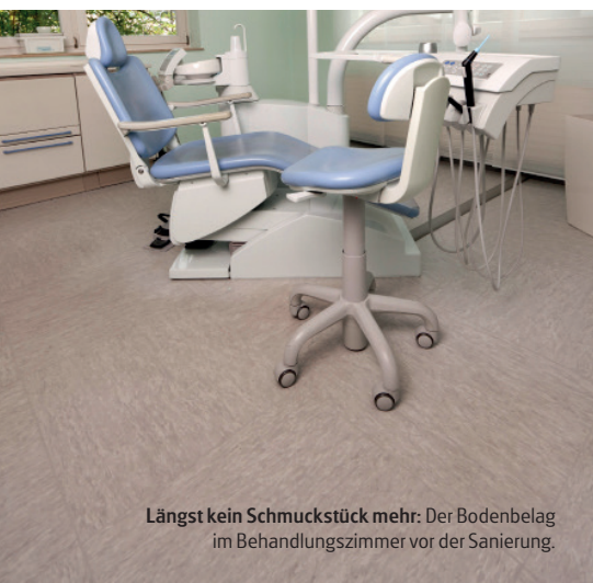
Längst kein Schmuckstück mehr: Der Bodenbelag im Behandlungszimmer vor der Sanierung.

Böden in Arztpraxen sind sehr hohen Belastungen ausgesetzt. Stuhlrollen, Geräte und Desinfektionsmittel lassen Böden schnell altern und unschön wirken. Nicht nur die Hygiene wird dann problematisch, auch das Vertrauen der Patienten kann leiden. Ebenfalls ist bekannt, dass ein psychologisch beruhigendes Farbkonzept, und damit auch das Erscheinungsbild der Bodenbeläge, von maßgeblicher Bedeutung für das Wohlbefinden der Patienten ist. Zahnarztpraxen stehen allerdings vor dem Problem: Das Entfernen eines alten und