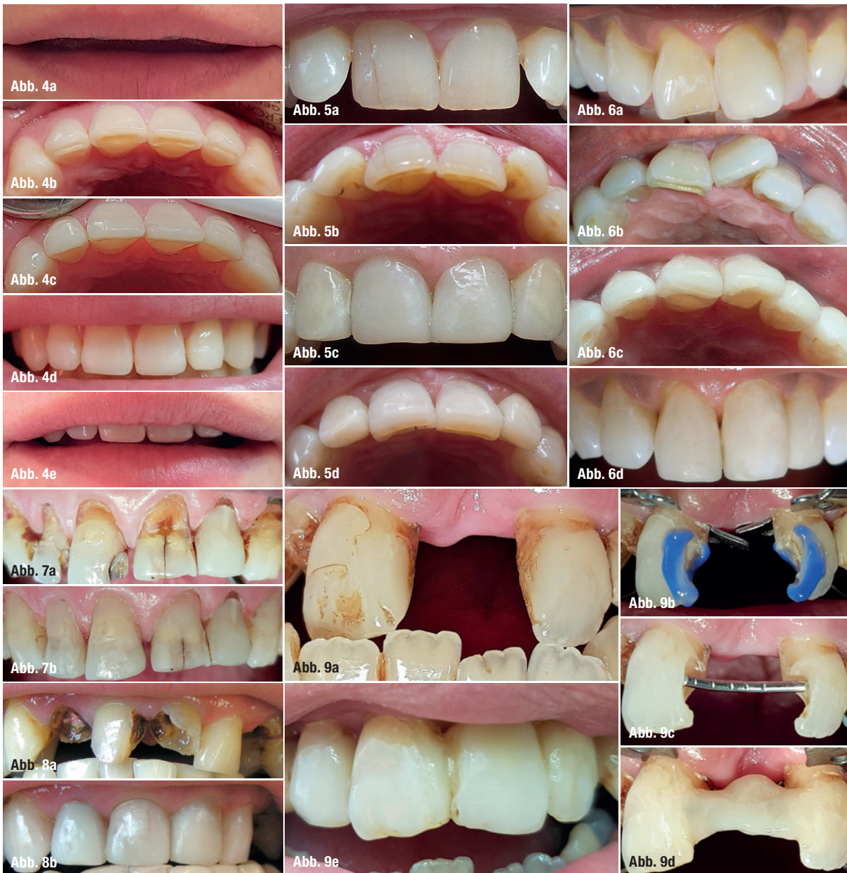
Abb. 4a: Zu kurze Frontzähne. Abb. 4b: 321+123 abradiert. Abb. 4c: 321+123 je 2–3 mm verlängert. Abb. 4d: Das Foto hilft, Politurfehler zu finden. Abb. 4e: Frontzähne verlängert. Preis: 624 CHF. Abb. 5a und b: 1+1 retrudiert, 2+2 protrudiert. Abb. 5c und d: 1+1 labial und 2+2 palatinal verdickt. 2+2 wurden beide labial reduziert und etwas zu hell restauriert, was die Patientin nicht störte. Preis: 808 CHF. Abb. 6a und b: 1+12 Schief- und Engstand. Abb. 6c: Ätzbild. +1 distal bis zur Schmerzgrenze reduziert. Abb. 6d: 1+12 labial und +1 palatinal verdickt. Preis: 704 CHF. Abb. 7a: 321+13 erodiert, verfärbt und mit defekten Füllungen. Abb. 7b: Schmelz und Dentin lediglich angefrischt. Überall zirkuläre Retentionsrillen. Preis: 472 CHF. Abb. 8a: 21+1 kariös zerstört. Abb. 8b: 1+1 Aufbau nach Endo (2 Sitzungen), 2+ Stiftaufbau (1 Sitzung). Preis: 1.265 CHF. Abb. 9a: +1 Lücke. 2+ Wurzelrest. Abb. 9b: Alte Füllungen entfernt. Abb. 9c: Verstärkungsdraht (1,2 mm). Abb. 9d: 2. Portion fertig. Abb. 9e: +1(2)3 Kompositbrücke. 2+ Aufbau, Preis: 1.010 CHF.

Matrizen und Klammern die Ästhetik überblicken. Zudem lässt er den Patienten das Komposit durch Zubeißen vorformen (mit Distelöl auf dem Antagonisten als Separiermittel), damit er die Okklusion vor der Polymerisation verbessern kann.