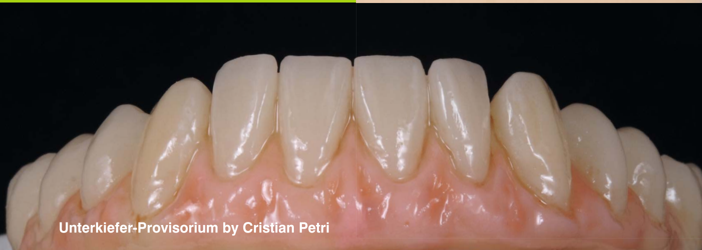
Unterkiefer-Provisorium by Cristian Petri