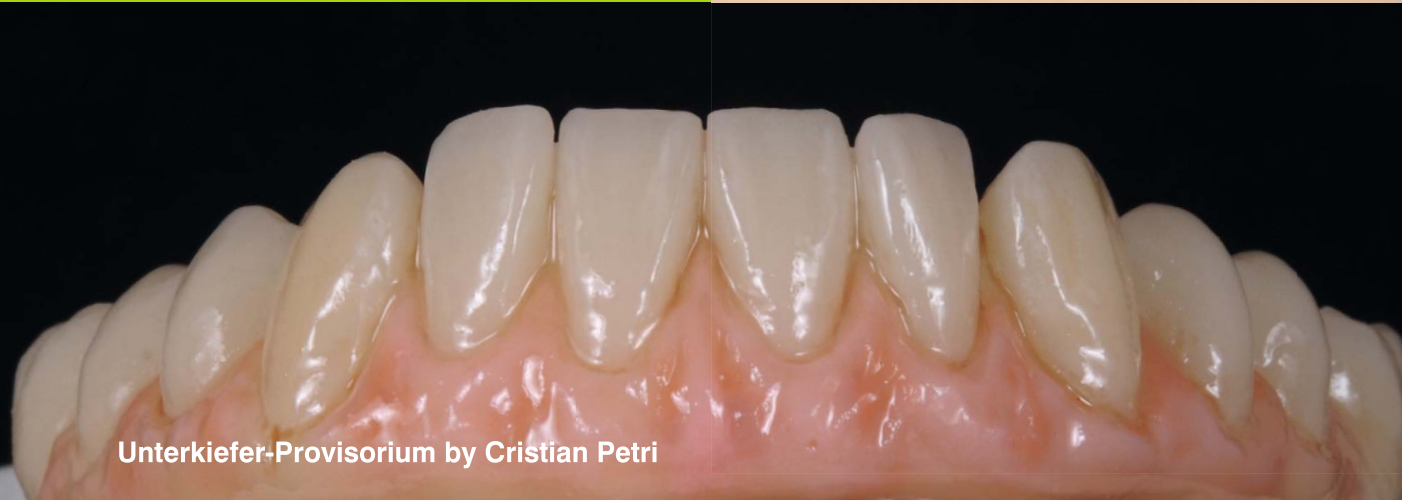
Unterkiefer-Provisorium by Cristian Petri