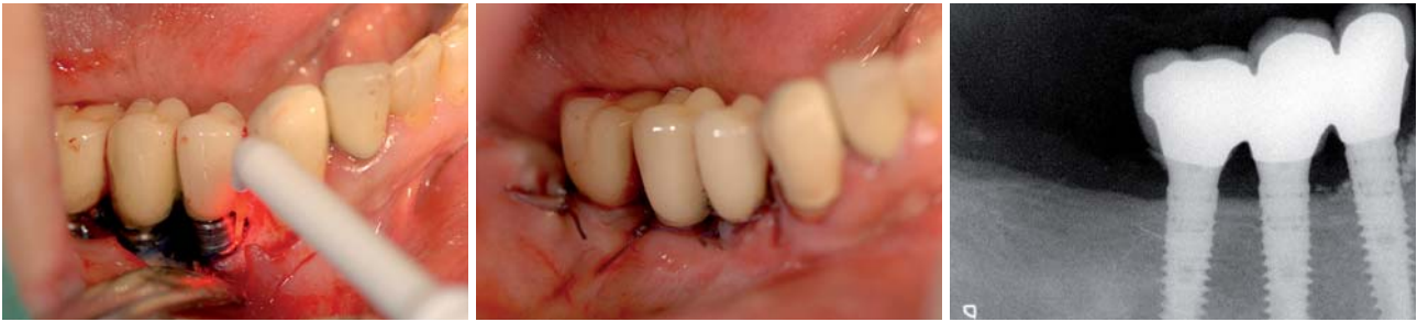
Abb. 16: Einsatz des HELBO-Lasers zur photodynamischen Therapie. – Abb. 17: Zustand nach Wundverschluss. – Abb. 18: Zustand nach Periimplantitistherapie.

destruktion an einem Implantat (Abb. 13). Die Patientin wurde mit analogem Protokoll behandelt, jedoch die Titanoberfläche mit einer speziellen Titanbürste gereinigt und mit Tigran Natix® grau augmentiert.