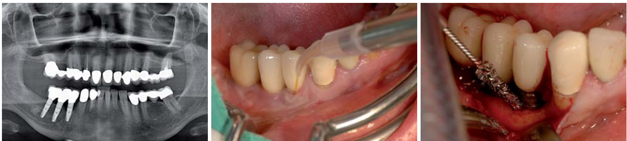
Abb. 13 bis 18: Fall 2 – Abb. 13: Röntgenologischer Ausgangsbefund. – Abb. 14: Diodenlaser zur Deepithelisierung. – Abb. 15: Reinigung der Implantatoberfläche mit der Titanbürste Tigran Brush No 1.

Bei einer 54-jährigen Patientin kam es fünf Jahre nach Augmentation mit einem retromolaren Knochenblocktransplantat und nachfolgender Implantation in Regio 44 zu einer schmerzhaften Periimplantitis mit Knochen-