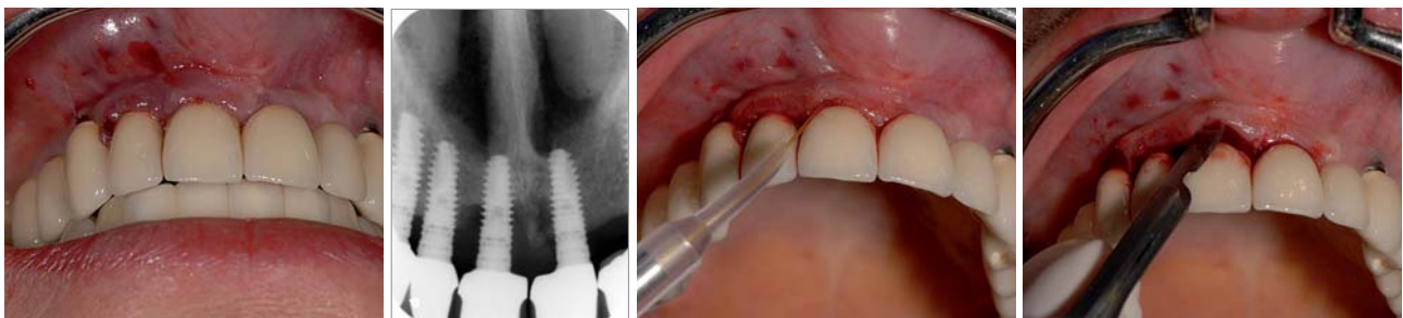
Abb. 1 bis 12: Fall 1 – Abb. 1: Klinische Ausgangssituation nach initialer Vorbehandlung. – Abb. 2: Röntgenologischer Befund mit Knochenabbau Regio 13,12 und 11. – Abb. 3: Deepithelisierung mit dem Diodenlaser. – Abb. 4: Intraskuläre Schnittführung.