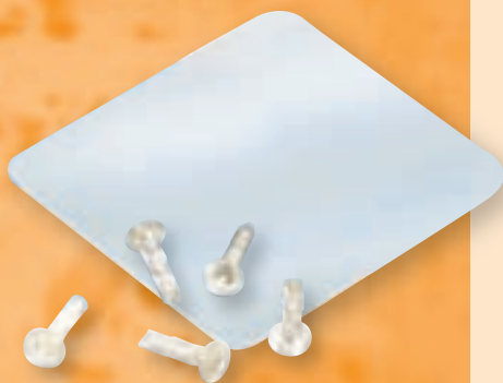
Membrane und Pins aus PDLLA