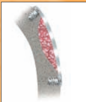
Schalentechnik mit 0,1 mm PDLLA-Folie