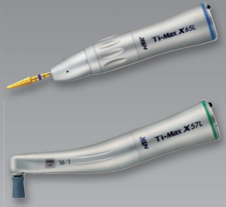
X57L 16:1 Untersetzung