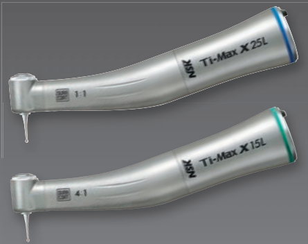
X25L 1:1 Übertragung