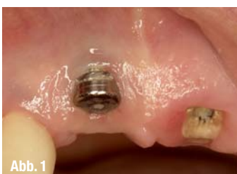
Abb. 4 _ Knochendefekt an 21.